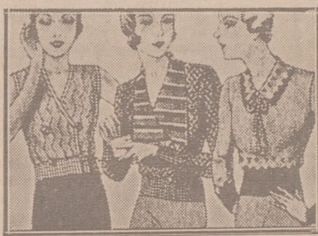
Blusas punto novedad a 5, 6, 8, 10 y 12 ptas.

Primera casa en confecciones para caballero, señora, jóvenes y niños Tejidos, Pañería y Sastrería