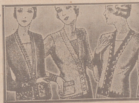
Blusas chaquetillas de 7, 8, 10, 12 y 15 ptas.