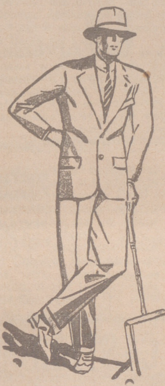
Trajos de paño, confección fina de 60, 70, 80, 100 y 120 pesetas. Grandes surtidos