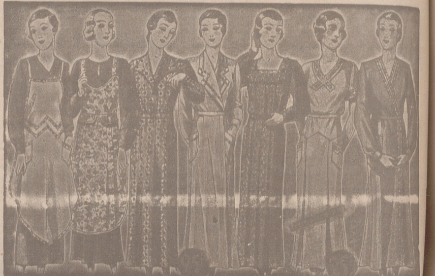
Vestidos, batas, kimonos de bañistas, percales o trovales, de 7, 8, 9, 10, 12 y 14

Primera casa en confecciones para caballero, señora, jóvenes y niños Tejidos, Pañería y Sastrería