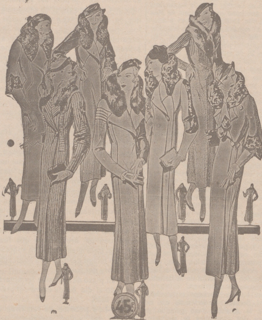
Abrigos señora, modelos novedad, a 20, 25, 30, 40, 50 y 60 pesetas. Abrigos para niñas, de 10, 12, 15 y 20 ptas. LA CASA MAS SURTIDA Y MAS BARATO VENDE

Casa Munguía () Plaza Mayor, 48 y Lain Calvo, 9 Sucursal: Plaza Mayor 5 BURGOS Primera casa en confecciones para caballero, señora, jóvenes y niños Tejidos, Pañería y Sastrería