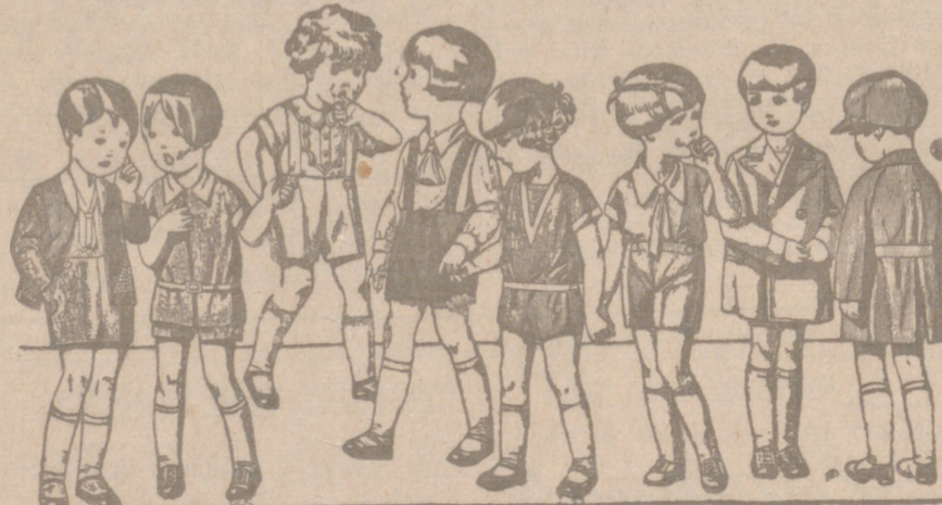
Diversidad de modelos en trajes para niños en punto, dril, lana o pana, de 5 a 15 ptas.

Casa Munguía Plaza Mayor, 48 y Lain Calvo, 9 Sucursal: Plaza Mayor, 5 BURGOS Primera casa en confecciones para caballero, señora, jóvenes y niños Tejidos, Pañería y Sastrería