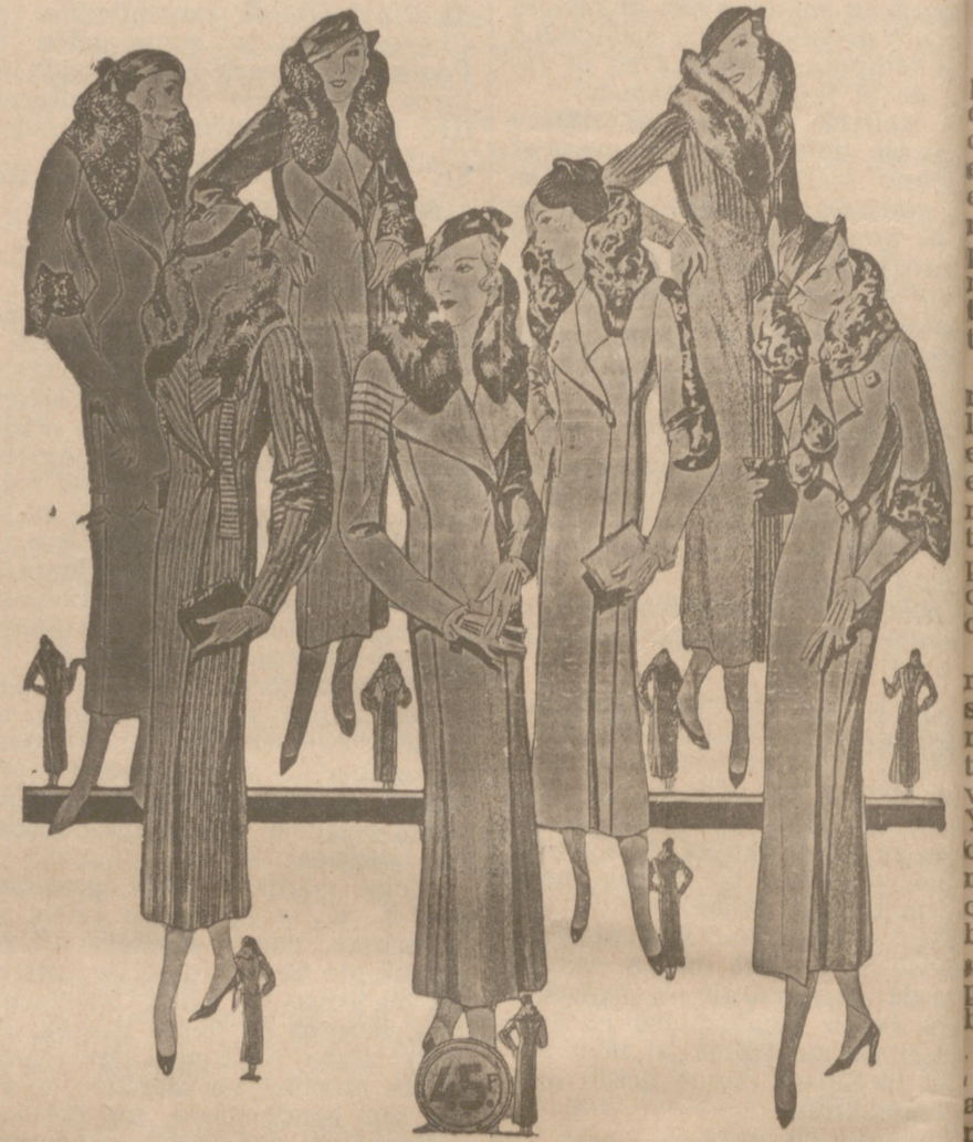
Abrigos señora, modelos novedad, a 20, 25, 30, 40, 50 y 60 pesetas. Abrigos para niñas, de 10, 12, 15 y 20 ptas. LA CASA MAS SURTIDA Y MAS BARATO VENDE

Plaza Mayor, 48 y Lain Calvo, Sucursal: Plaza Mayor, 5 BURGOS Primera casa en confecciones para caballero, señora, jóvenes y niños. Tejidos, Pañería y Sastrería