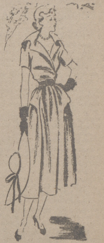
Modelo de pique blanco adornado con detalles negros...