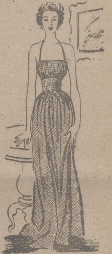
Este camión puede ser también un bello traje de noche...