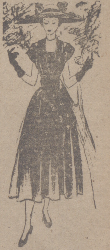
Bonito vestido de organdi azul marino, con motivos estampados...