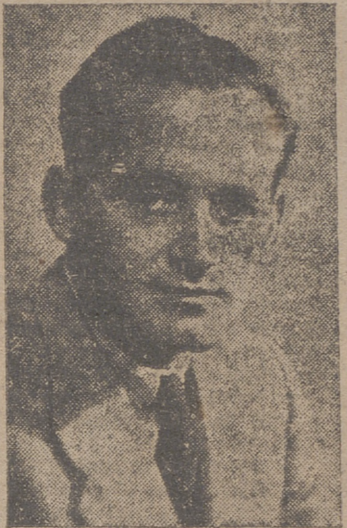
Invitaciones para dar una serie de conferencias, principalmente en Italia.