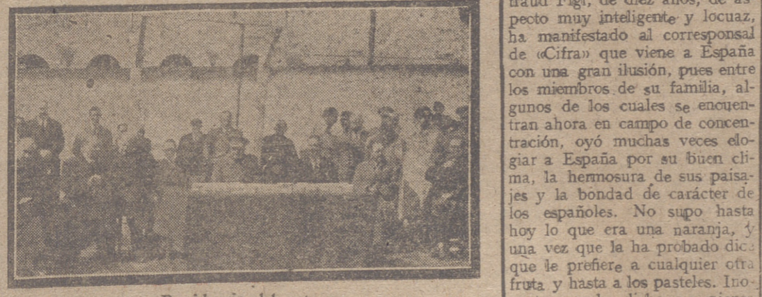
Presidencia del acto

Los actos fueron presididos por el gobernador militar, gobernador civil y otras autoridades