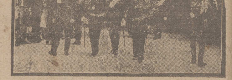
Las fuerzas que rindieron honores desfilando antes las autoridades

Las autoridades civiles y militares a la salida de la misa