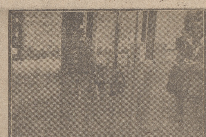
Los efectos de tan terrible tormenta fueron aún más desastrosos en los pueblos de nuestra provincia, de lo cual damos a continuación una detallada información, que nos ha sido facilitada en unos, por sus respectivos Ayuntamientos, y en otros, por sus puestos de la Guardia Civil. Queremos hacer constar nuestro agradecimiento al personal de servicio de la Compañía Telefónica Nacional, que tan amablemente nos prestó una valiosa colaboración al facilitarnos con gran rapidez las conti-