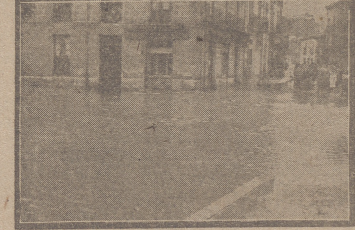
Los efectos de tan terrible tormenta fueron aún más desastrosos en los pueblos de nuestra provincia, de lo cual damos a continuación una detallada información, que nos ha sido facilitada en unos, por sus respectivos Ayuntamientos, y en otros, por sus puestos de la Guardia Civil. Queremos hacer constar nuestro agradecimiento al personal de servicio de la Compañía Telefónica Nacional, que tan amablemente nos prestó una valiosa colaboración al facilitarnos con gran rapidez las conti-