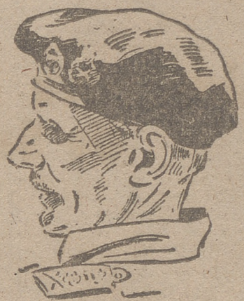
(Información en la página 3.ª)

A causa de la tormenta que descargó ayer sobre Valladolid y que provocó diversas interrupciones en el suministro de fluido eléctrico, las ediciones de LIBERTAD se postponen hoy a la venta con cierto retraso. Rogamos a nuestros lectores nos disculpen esta excepcional demora, que en modo alguno cabe atribuir a nuestra voluntad.