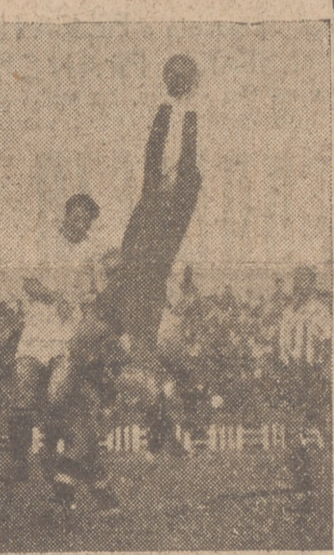
(Amplia información y comentarios en nuestra ÚLTIMA PAGINA)