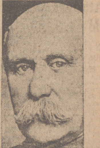
ex jefe de Estado, «L'Humanité», órgano del Partido moscovita, dedicó lo mejor de su primera plana a una encuesta encarecida. (Pasa a la página 4.º)