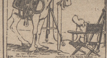
—Me paso la vida entera haciendo películas del Oeste. ¡Dicen que soy el tipo propio para esta clase de películas!

El Cairo, 6.—Abdul Rahman Azzam Bajá, secretario general de la Liga Árabe, ha manifestado que la reunión del Consejo Político de la Liga, que según había declarado iba a ser aplazada hasta el próximo miércoles, para dar tiempo a los delegados a llegar a El Cairo, se celebrará como se había acordado en principio, el próximo lunes. En dicha reunión se estudiarán las medidas que han de tomar los árabes en relación con la decisión de la ONU para la partición de Palestina.—Efe.