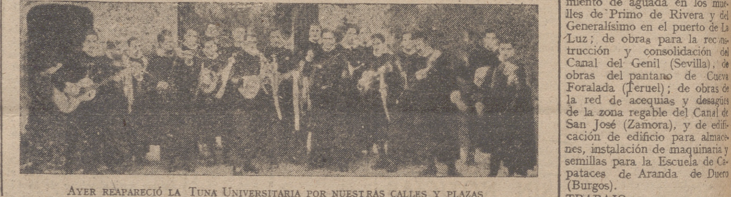
AYER REAPARECIÓ LA TUNA UNIVERSITARIA POR NUESTRAS CALLES Y PLAZAS