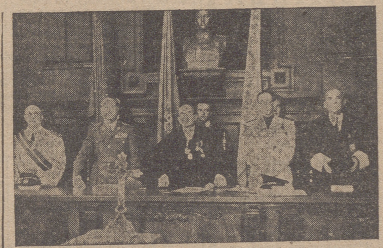
Presidencia del acto en la Universidad