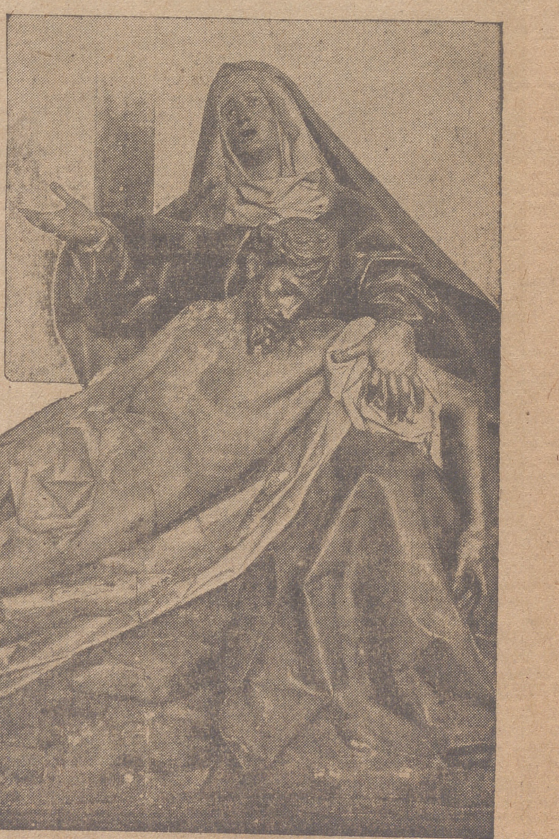
Injuntó dolor de la Madre que recibe en sus amorosos brazos el cuerpo malturado y sin vida del Hijo, expresado en la magnífica talla de Gregorio Fernández, que guarda como rico tesoro nuestro Museo Nacional de Escultura