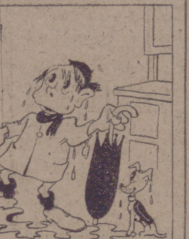
—Ya te dije que vinieras contra la pared, por debajo de los canalones. ¿Lo has hecho? —A ver, sí no...!