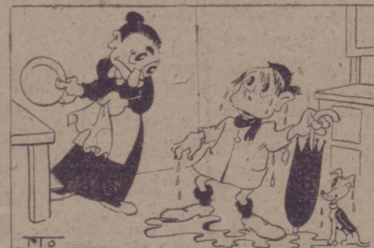
—Ya te dije que vinieras contra la pared, por debajo de los canalones. ¿Lo has hecho? —A ver, sí no...!