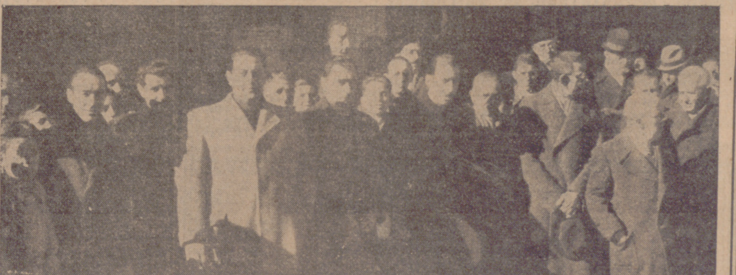
Jerarquías y autoridades asistentes a la solemne misa en honor de San José de Calasanz