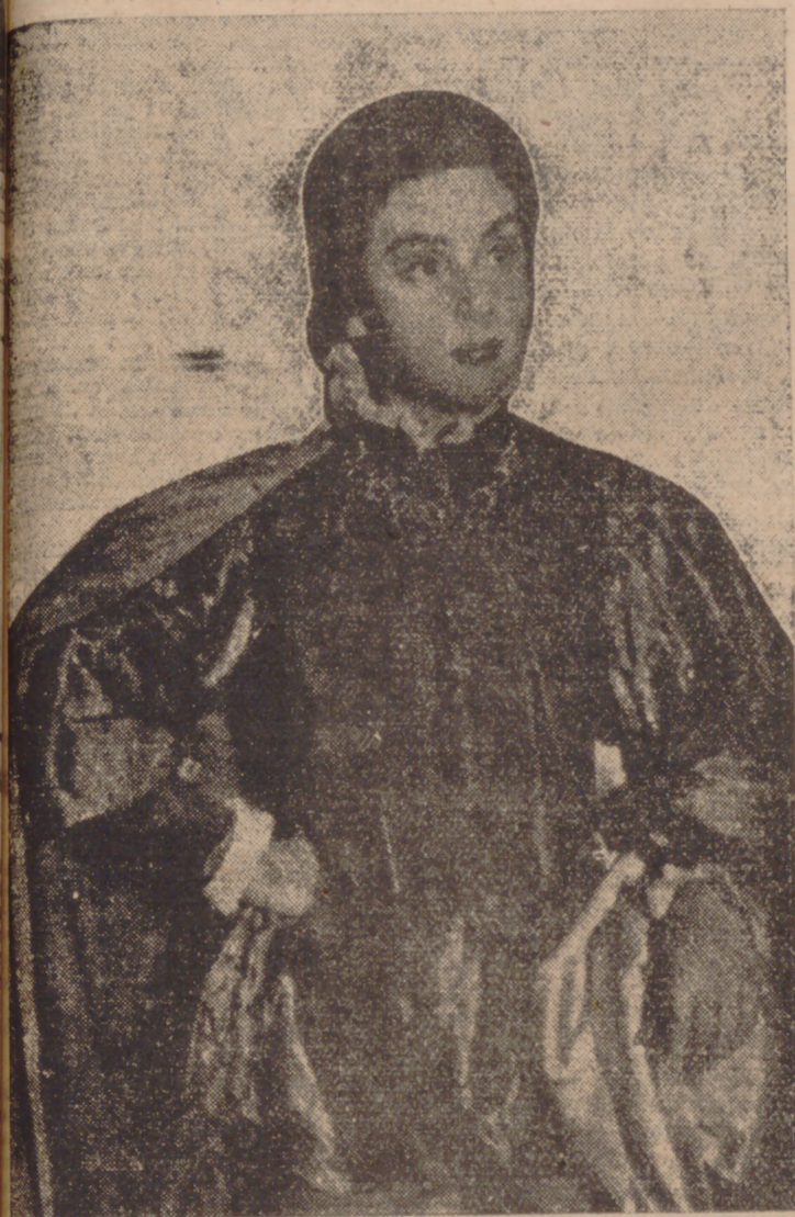
La artista del cine y teatro Ana Mariscal en su figuración de "Don Juan Tenorio"