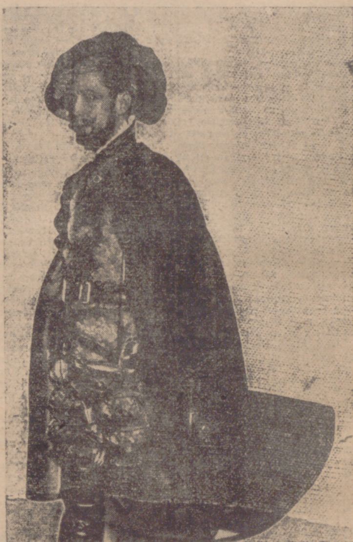
«Don Juan Tenorio», la popularísima figura zorrillesca del teatro español, víctima en este original proceso