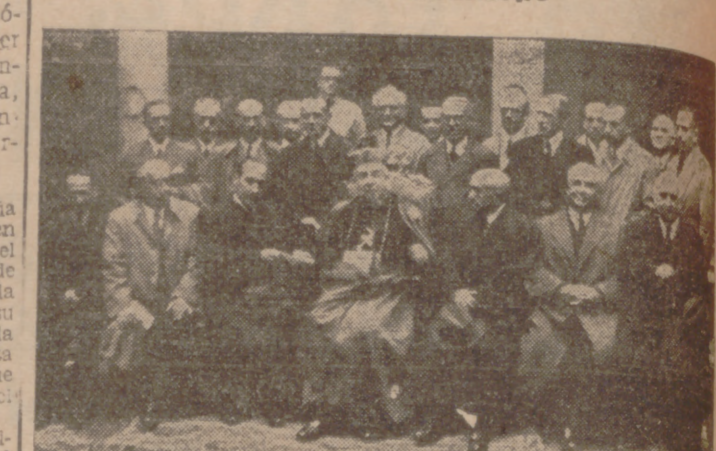
En el Palacio Arzobispal

El acto fué presidido por el excelentísimo señor Arzobispo