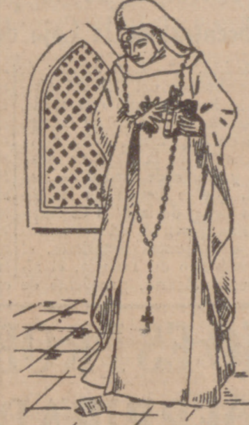
"Ni a mí, que el orbe es testigo de que hipocrita no soy, pues por doquiera que voy va el escándalo cómico."

Lo que esta diatriba causará al público ingenuo que ríe cuando Cuiti toma en sus brazos a Brígida (figura que le malhumora por su celestinesca tracción); al hacer esta crítica no se habrá pensado en el gusto del espectador, que hace reír en la escena del sofá (quizá la más violenta del drama), declarada posiblemente a sombrerozcos y a gritos por un actor barrigudo y de ronca voz. Cuando esto se ha dicho el "Don Juan" más popular, ha sido sin pensar en los que se sientan el escultor y se sobrecojen cuando habla y oír la estatua del Comendador y cuando retumba la caldabada postrera, ni en los que hacen las primeras palmas cuando "Don Juan dice":