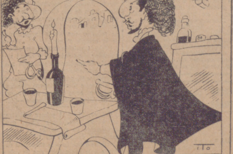
—Vamos, don Luis, que esas no son las del año pasado; ahí ha metido quince o veinte de estraperlo.

ENOS A ULOS RADERA aciones de la película manita rdomo Franchot To y Pat O'Brien MARANA cimiento NO MIJA o Verde onanzas avent cción de gran magnífica pre menores ROXY 3,30 a 7 LAS 730 AS 1015 ESTRENO trabajo se ha andado por cañal amado FOSO CHARLES LAUGHTON A RAINES ARRION y 1015 Hoy de los acor estreno cuan tiempos OS NOS ra creación de Durbin table galán COTTEN más adorabl viviendo así una ilusión en la magia d inolvidable ENTE GRANDES ENOS y 1015 Hoy superproducción real CONCORDIA y Ella Raines JERIA completa, con aciones numer mostrados por E. CAMPO Minaso atenciones se re también en sp Anunciate", p 12, teléfono 6 Publicidad de Santiago, 65, p 1320. VENDEN 400 de chopo, soca sozas secas y dos platos; a de 1300 a 1 grúa metal binedo, Santia OS, se venden que en térmi antialpino Razona Andrés, Haza i). ENZANAS, 817 de un un partidas completos envases Arriónas