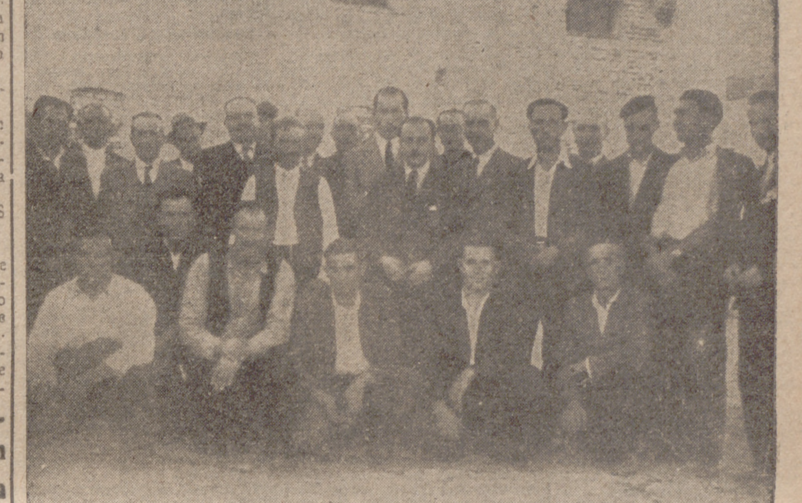
El excelentísimo gobernador civil y jefe provincial del Movimiento, camarada Romojaro, acompañado de las autoridades y otros asistentes a la entrega de la finca "Coto de Foncastín", adquirida por el Instituto de Colonización en beneficio de treinta y cinco colonos leoneses. La primera autoridad de la provincia rodeada de los nuevos vallisoletanos después del acto de la distribución de los terrenos.