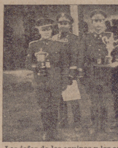
Los jefes de los equipos y los campeones que resultaron clasificados en los primeros puestos, con los trofeos ganados.

El general Palenzuela y las demás autoridades presentes felicitaron a los participantes los cuales, antes de verificarse el reparto de premios hicieron unas exhibiciones que fueron muy del agrado de las expresadas personalidades.