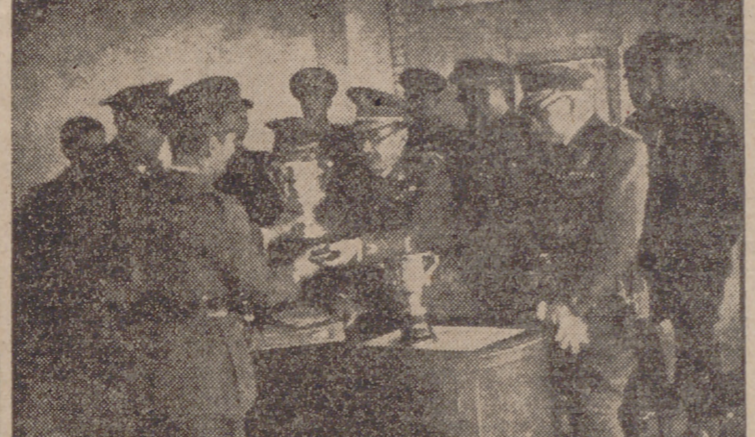
El general Palenzuela entregando la copa del Excmo. señor capitán general al campeón regional de tiro por equipos.

Por equipos quedó campeón el Séptimo Grupo de Automóviles de Valladolid, con 218 puntos