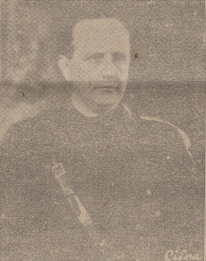
arreglo a ciertos trámites previamente establecidos.