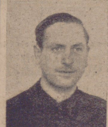
Estos dos excelentes y viejos camaradas de la Falange vallisoletana, condecorados el domingo con la Encomienda de la Orden de Cisneros, en estas sencillas y sinceras manifestaciones nos reflejan su opinión entusiasta y falangista sobre la trascendental fecha fundacional del 4 de marzo y su significado para la vida y salvación de España. (Información en la página última.)