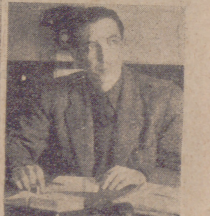
Estos dos excelentes y viejos camaradas de la Falange vallisoletana, condecorados el domingo con la Encomienda de la Orden de Cisneros, en estas sencillas y sinceras manifestaciones nos reflejan su opinión entusiasta y falangista sobre la trascendental fecha fundacional del 4 de marzo y su significado para la vida y salvación de España. (Información en la página última.)

Tropas norteamericanas han entrado en Colonia (INFORMACION EN LA PAG. SEXTA)