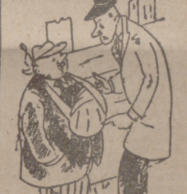
—No, ningún accidente, pero como he llevado mi reloj de pulsera al Monte de Piedad, me he vendado de este modo para que mi mujer no se diera cuenta.