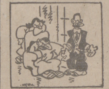
—Se halla en plena crisis de moralidad, doctor... Usted es el quinto médico al que le quita el reloj mientras que le están tomando el pulso.