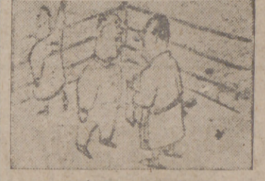
EN EL «RING» El árbitro.—Caballero, se ha confundido. ¡Esto no es el cuarto de baño!