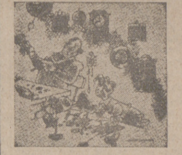
PARADOJA —Oye, niño; aquí se viene para trabajar de firme y no para mirar constantemente al reloj.