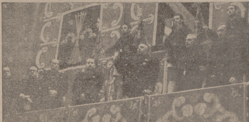
Madrid.—S. E. el Jefe del Estado, Generalísimo Franco, durante su discurso en la sesión de clausura del Consejo General del Frente de Juventudes.