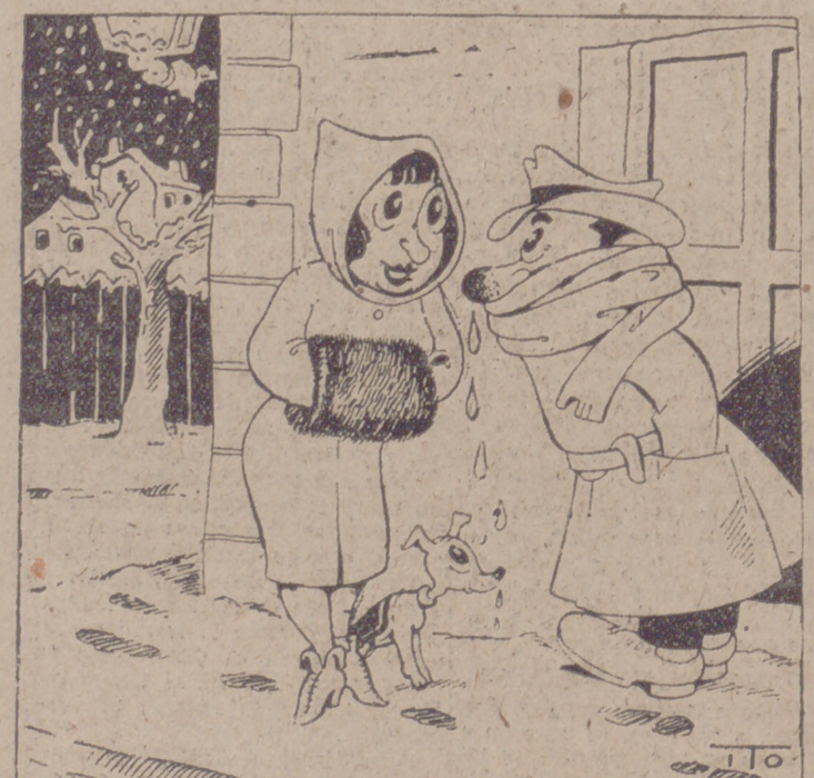
—Créeme, Lili, mi amor por tí es un volcán. (Por ITO)

Roma, 19.—La Radio romana ha anunciado que el Gobierno italiano ha reconocido al Gobierno chino de Chungking y que un embajador será nombrado en breve.—Efe.