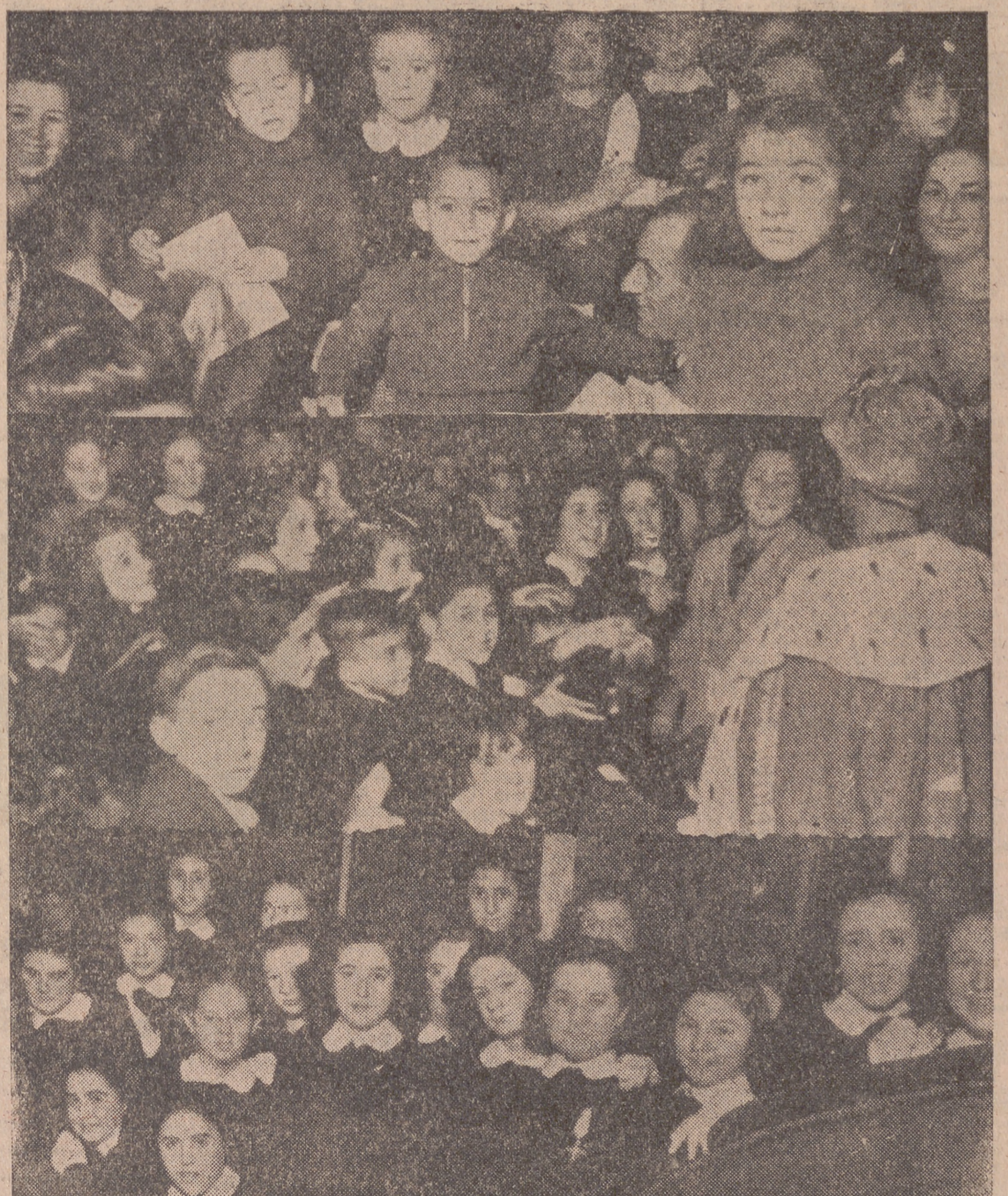
La representación de «La Cenicienta», verificada ayer en Calderón — que constituyó un gran éxito para organizadores e intérpretes — se vió asistida del entusiasmo del público infantil, que llenó el teatro por completo. — He aquí tres fotos de los pequeños espectadores, que gozaron lo indecible en esta jornada.