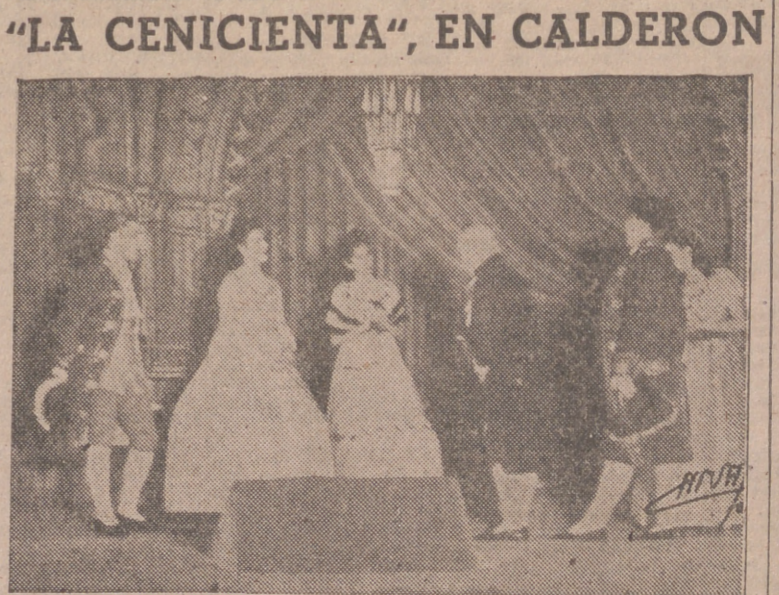
Un momento de la feliz interpretación de «La Cenicienta», representada ayer en Calderón con enorme éxito y asistencia de público infantil.