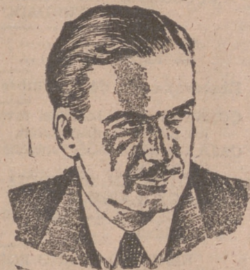
Un pastor muere repentinamente a los 103 años de edad

París, 6.—La Embajada francesa en la capital soviética ha dado una recepción de gala en honor del general De Gaulle, a la que asistieron el comisario de Asuntos Exteriores, Molotov y otros altos oficiales soviéticos y miembros del Cuerpo diplomático. El martes, por la mañana, De Gaulle recibió a varios embajadores de las Naciones Unidas en Moscú.—Efe.