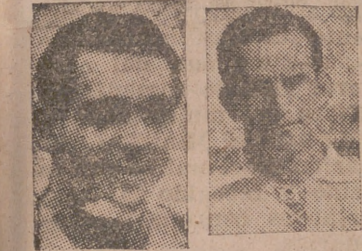
Sevilla, 19.—Sevilla, 3 (Ariza, Iturbe, Campanal); Valencia, 2 (Igoa y Gorostiza).

El encuentro, en su desarrollo, ha ofrecido matices de gran emoción; jugaron un auténtico partido de campeonato, y tanto el Valencia como el Sevilla procuraron en todo momento superarse. El equipo sevillano hizo un primer cuarto de hora espléndido y hasta sacó a relucir una furia que estaba ya en desuso en Nervión.