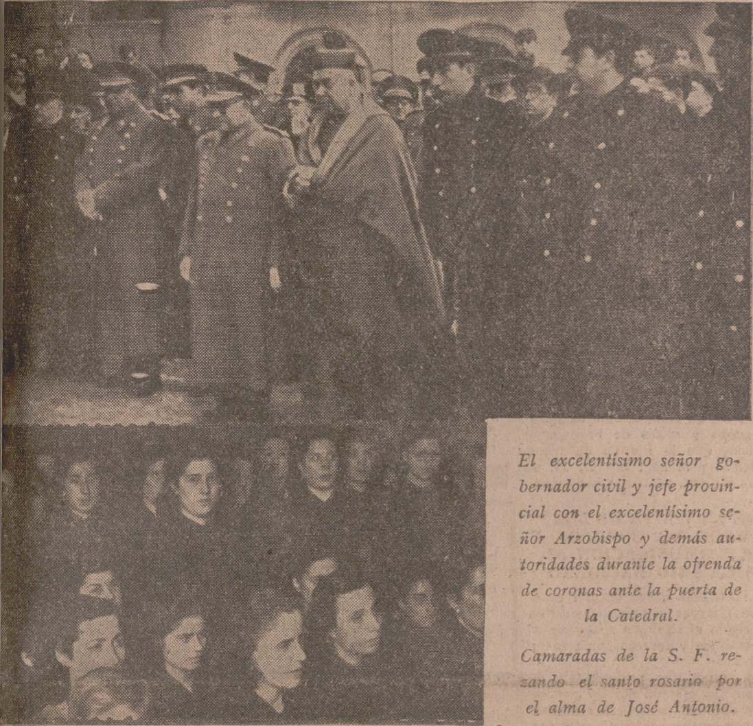
El excelentísimo señor gobernador civil y jefe provincial con el excelentísimo señor Arzobispo y demás autoridades durante la ofrenda de coronas ante la puerta de la Catedral.

El Gobierno, consejeros nacionales y otras altas jerarquías asistieron a los solemnes actos de El Escorial