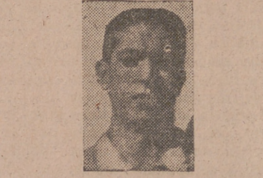
Barcelona, 19.—Sabadell 4 (Gracia, 3; Tellechia); Murcia, 0.

Victoria clara y rotunda del Sabadell, que pudo ser mayor aún, ya que se mostró superior en todo momento a su enemigo. Mercedo triunfo, como premio al tesón de un conjunto que no se deja amilanar por anteriores actuaciones desgraciadas y que en este partido funcionó a la perfección en todas sus partes.