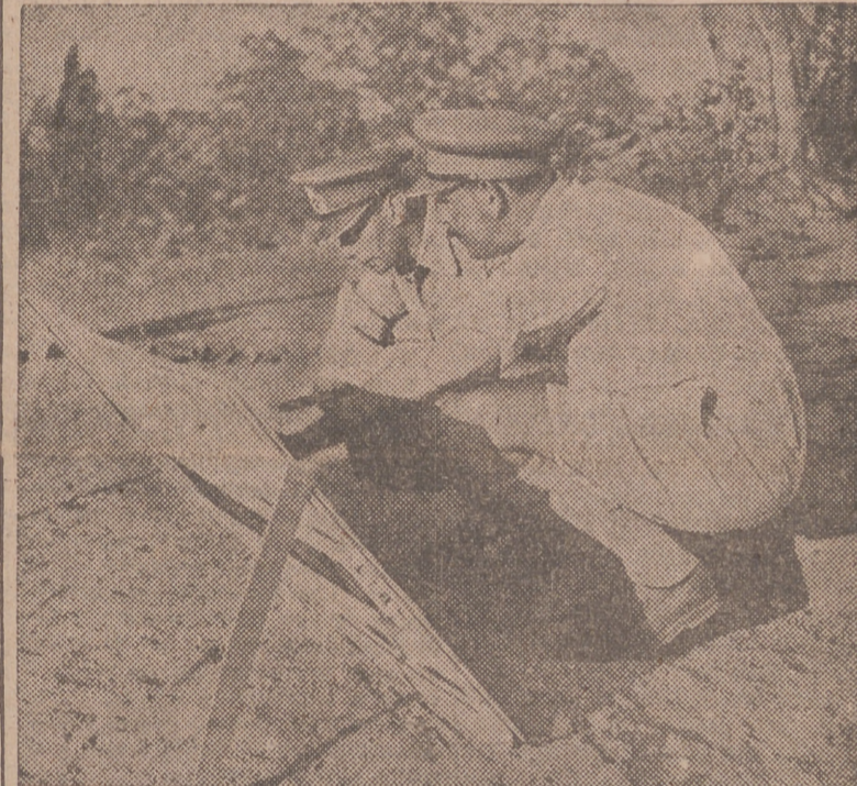
El general Lesse explica a Jorge VI el plano de operaciones durante la reciente visita de éste al frente italiano.