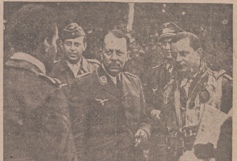
Un aviator de caza alemán cuyo aparato fué derribado por los angloamericanos, pudo salvar la vida después de muchas penalidades.