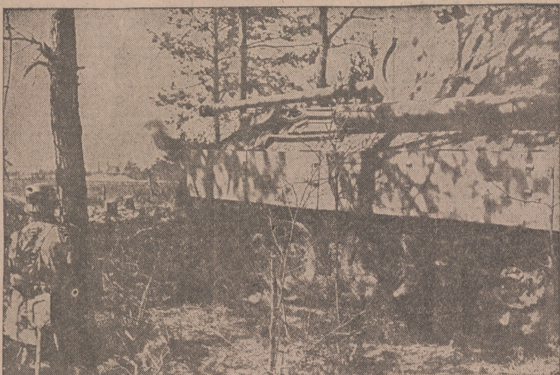
Infantes alemanes y tanques del nuevo tipo «Pantera» durante un contraataque en el frente central de Rusia.