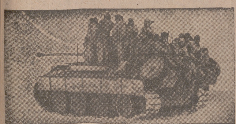
Tanques del tipo «Tigre» inician el ataque contra una división soviética en el sur del frente oriental.