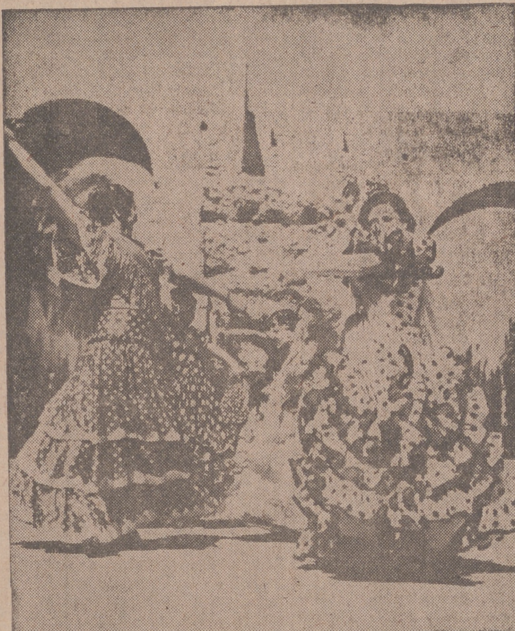
Como en años anteriores se está celebrado en Sevilla la Feria de Primavera. En barracas, patios y en cuantos lugares se prestan para ello, mujeres andaluzas, con sus trajes típicos, interpretan los clásicos bailes andaluces, llenos de belleza y alegría.