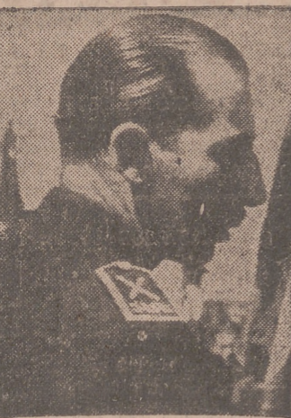
Madrid, 11.—El ministro secretario general del Movimiento ha firmado las siguientes disposiciones: