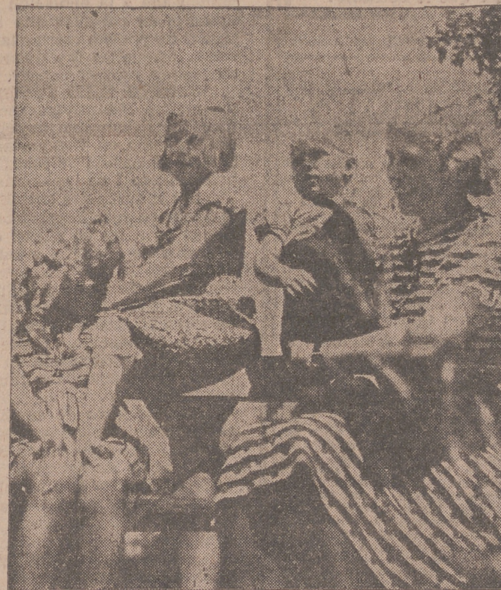
Madres alemanas felices con sus hijos evacuados