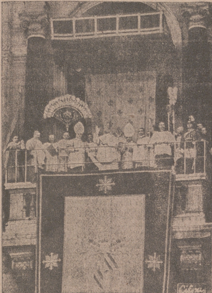
Inmediatamente después de ser coronado, Su Santidad Pío XII bendice a la inmensa multitud estacionada en la Plaza de San Pedro.