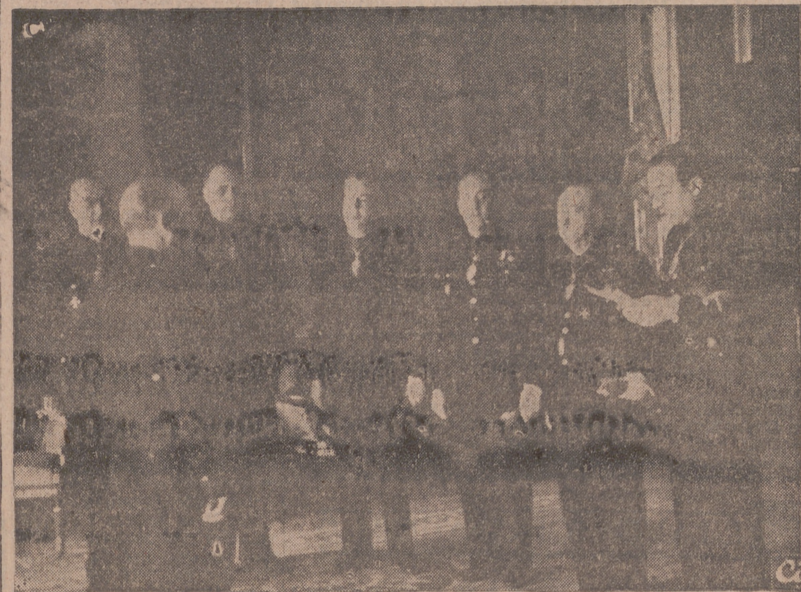
MADRID.—S. E. el jefe del Estado, Generalísimo Franco, recibe en el Palacio de El Pardo la Medalla de oro de la ciudad de Reus.