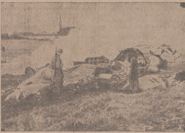
He aquí los restos de un avión cuatrimotor anglo-norteamericano de bombardeo derribado por las defensas alemanas sobre una pradera al intentar efectuar una incursión.