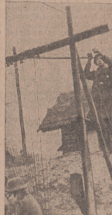
En nuestra fotografía vemos un puesto de telégrafos en el frente del Este.

El enemigo condujo refuerzos a la región entre Kitovograd y Belai Zerkof y continuó sin interrupción sus ataques. Uno de nuestros grupos de combate rechazó los ataques concéntricos de los elementos acorazados enemigos y destruyó cuarenta y cuatro carros de combate soviéticos en los dos últimos días.