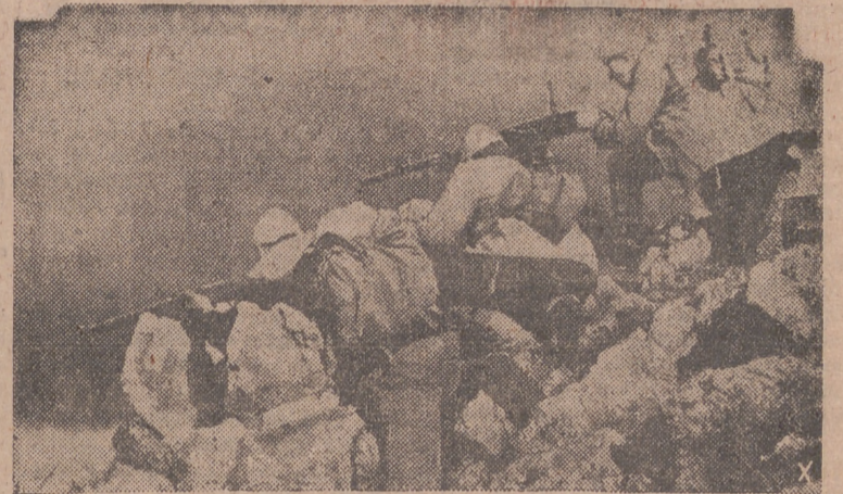
Legionarios croatas combaten unidos con los alemanes contra las bandas de Tito