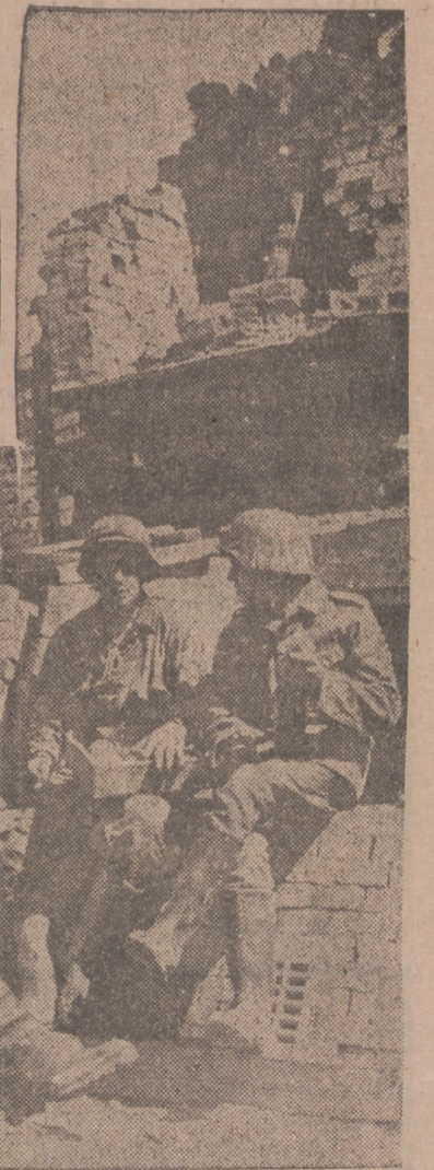
Acaba de llegar un envío de víveres y vino de la Patria, que causan una alegría extraordinaria a los soldados alemanes.