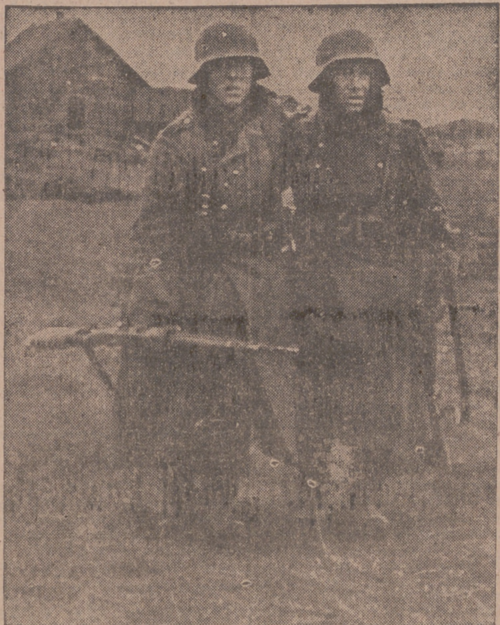
Un soldado alemán ha sido herido e inmediatamente el que combatía a su lado le ayuda a ir hasta el puesto sanitario más cercano.