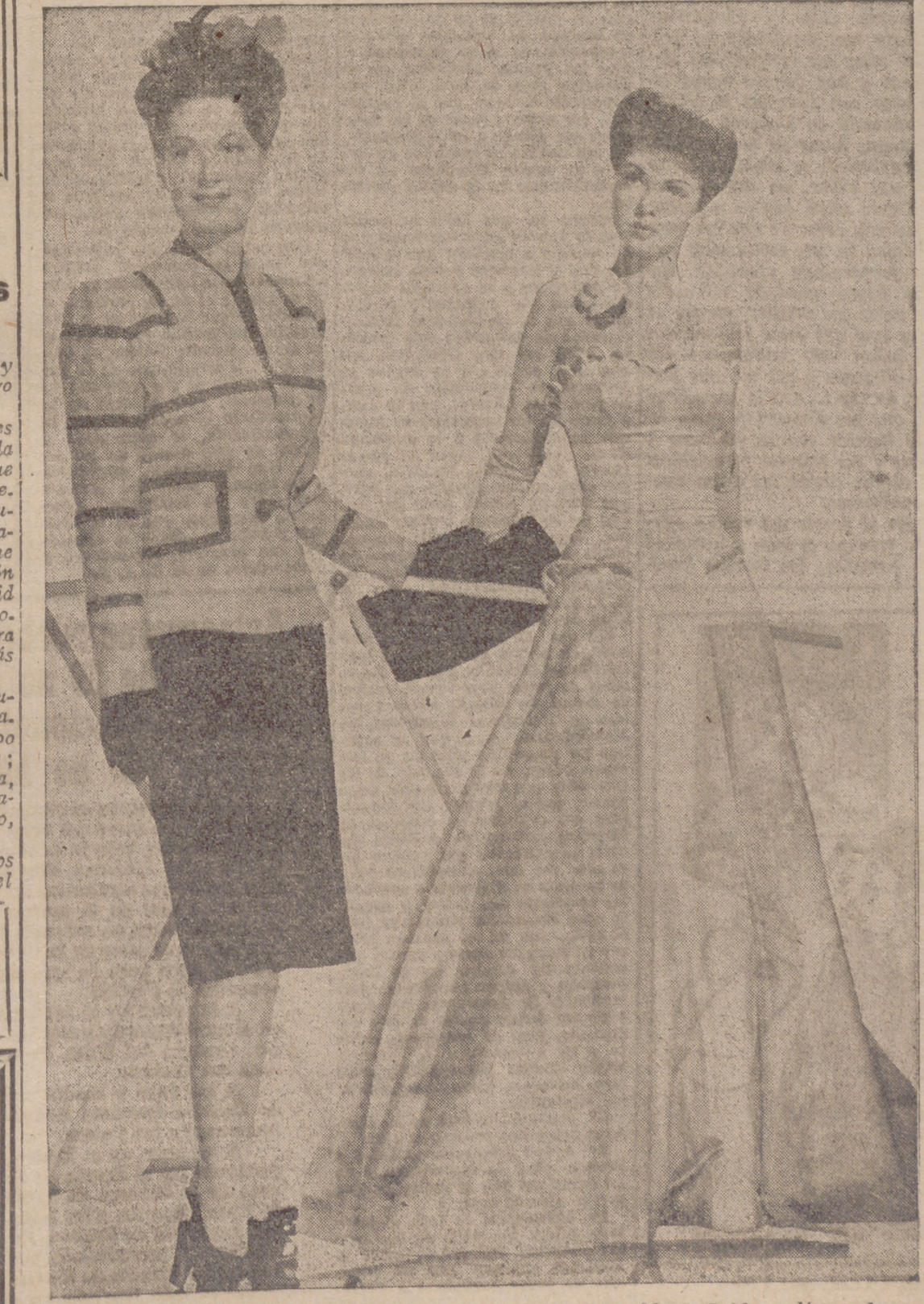
Marta Linden y Kathryn Grayson, nuevas estrellas de la Metro Goldwyn-Mayer, lucen, respectivamente, un elegante y moderno traje compuesto de chaqueta y falda y un precioso vestido de noche de gran gusto