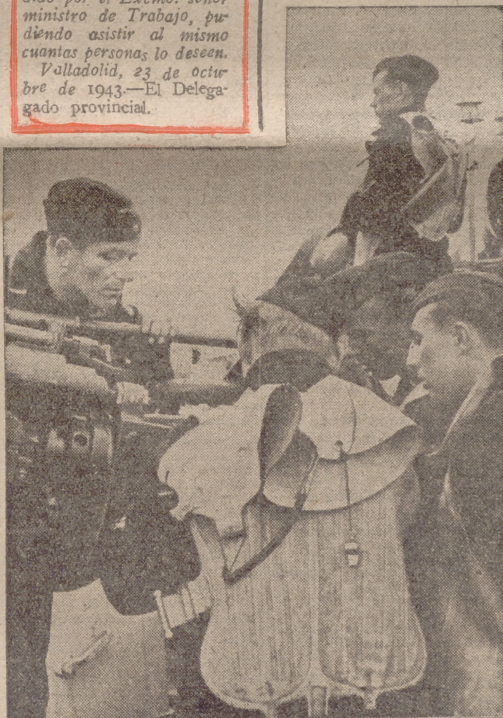
En el barco alemán, el cuidado y limpieza de cada una de las piezas artilleras se hace diariamente