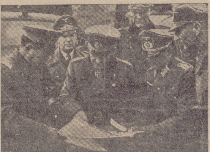
El general de brigada Onodera, agregado militar del Japon en Estocolmo, es informado por altos jefes alemanes de la inexpugnabilidad de las fortificaciones alemanas en Noruega.