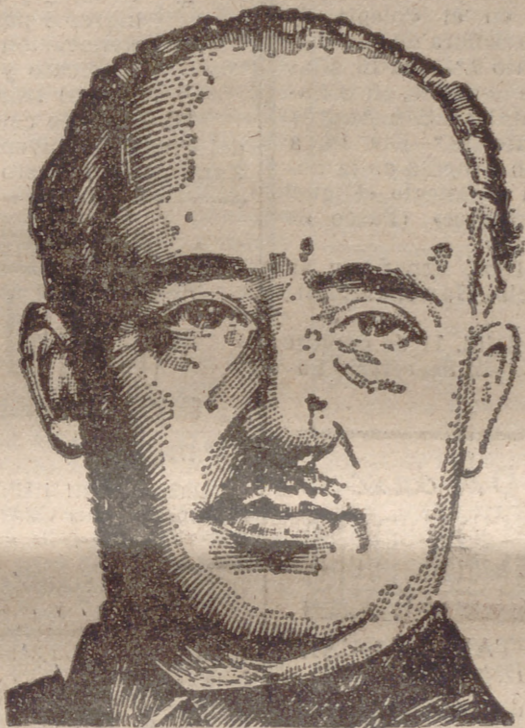
“Profesores y alumnos universitarios”

Hace ya cerca de cinco años, desde que el último clarín anunció el final de nuestras batallas y desde que ondearon sobre nuestros campos y ciudades las banderas victoriosas de la paz, que vivimos día a día una vida penosa y dura, consagrada por entero a la empresa generosa de reconstruir una Patria en ruinas, restableciendo su estructura nacional, revalorando sus perfiles históricos, encajándola de nuevo en la senda de su subsistencia milenaria y superando a la vez, sin reparar en la lejanía de la meta, ni en la inquietud de los incesantes obstáculos, la situación material y moral en que estaba sumido nuestro pueblo cuando alboró el comienzo de nuestra Cruzada.