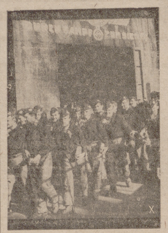
Jóvenes alemanes regresan a la patria después de su travesía a bordo de un submarino, que llega cargado de gloria.

de la agencia Reuters—no ha concedido hasta ahora ninguna consideración especial a Roma, aparte de las instrucciones dadas a las tripulaciones de que evitaran que fueran alcanzadas las instituciones religiosas y culturales.