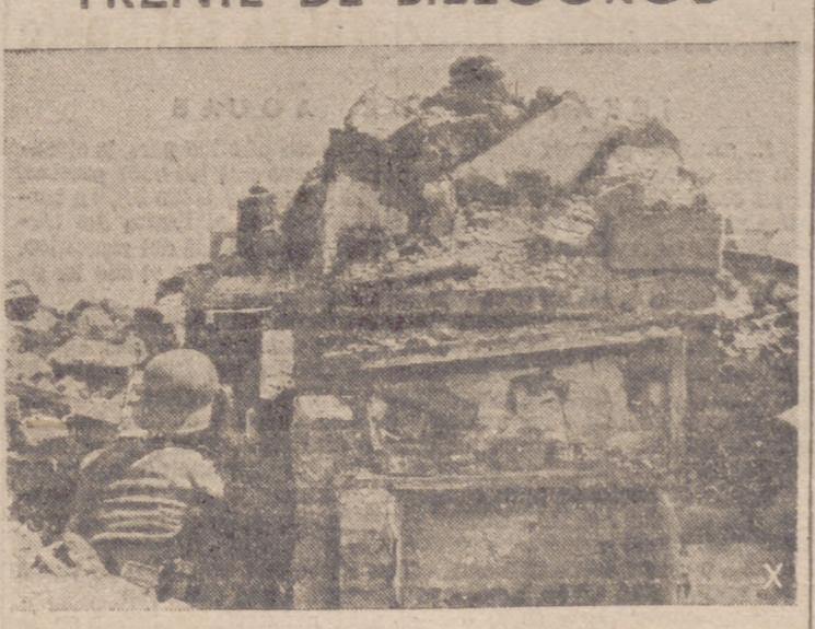
Sin descanso, los puestos de observación vigilan atentamente, estratégicamente situados, para posibilitar a sus camaradas alemanes la realización de sus misiones.