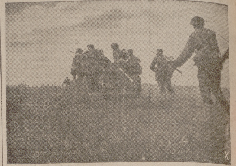
En la zona de Orel, las tropas alemanas son profundamente adelantadas en las posiciones enemigas que han sufrido graves pérdidas. Un cañón antitanque entra en acción.