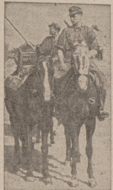
Los caballos prestan un gran servicio en la conservación de las líneas de comunicaciones en el frente.

haber alcanzado la línea principal de combate. Las fuerzas navales alemanas ligeras hundieron en la noche del 11 de agosto, a lo largo de la costa del Cáucaso, un cañonero soviético y una lancha rápida y averiaron gravemente a otra lancha rápida. Otras fuerzas navales alemanas bombardearon con éxito, en la misma noche, las posiciones soviéticas del frente del Mius cercanas a la costa. En Sicilia se prosiguen metódicamente los movimientos de despeje en una posición de la cabeza de puente más reducida. El adversario, que avanza en el sector Norte a lo largo del litoral, ha sufrido en los encarnizados combates de defensa sensibles pérdidas. (Pasa a la página quinta.)