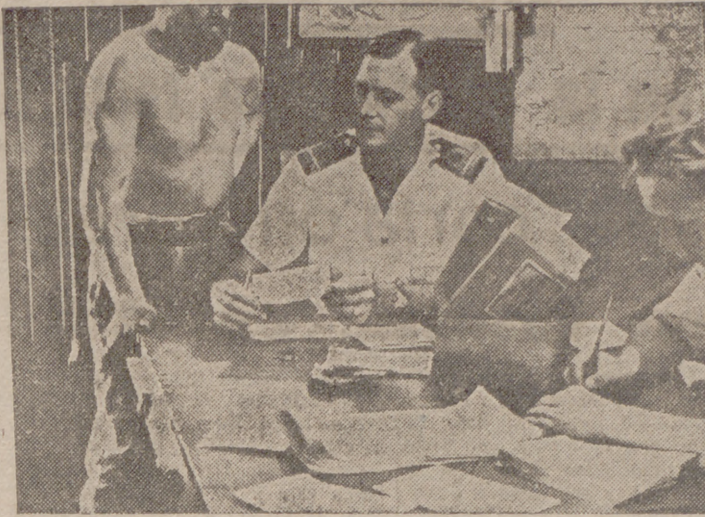
Marinos sudafricanos votan ante el comandante del barco para las elecciones de Africa del Sur.