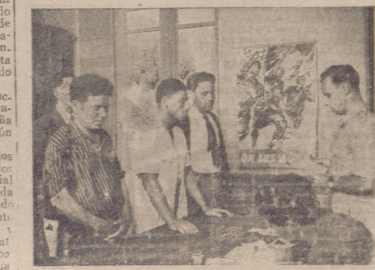
Aquí a tres habitantes de la isla de Malta alistados en el Cuerpo Voluntario de Sicilia.