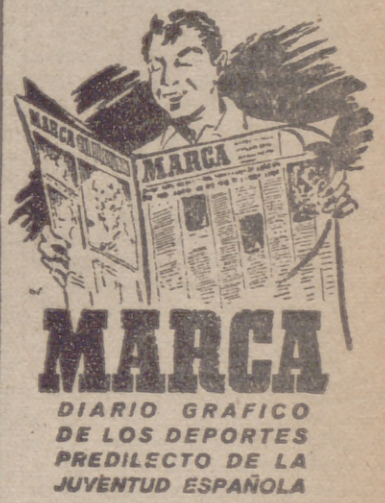
Administración: Carretas, 10. Madrid.

Barcelona, 9.—Los generales y jefes de la Escuela Superior del Ejército estuvieron ayer en Moniserrat, donde visitaron el Monasterio y la sana montaña. Igualmente visitaron el sector del Bruc. Hoy han estado en la Maquinista Terrestre y Marítima y en la Cooperativa del Gobierno Militar y talleres de construcción de filobuses. Esta tarde visitarán la Maestría de Artillería y a las siete la residencia de oficiales, donde están obsequiados.—Cifra.