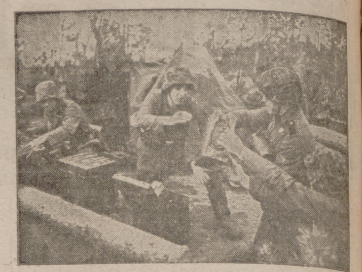
Han llegado a este sector del frente más municiones y estos soldados alemanes forman inmediatamente una cadena para hacerlas llegar cuanto antes a la pieza que sirven.