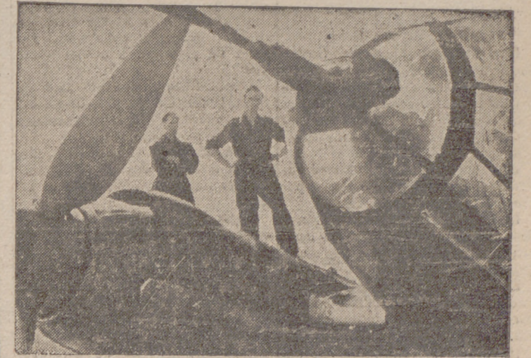
Aviones de combate alemanes dispuestos a despegar para un vuelo contra el enemigo, esperan sólo la llegada de los pilotos.