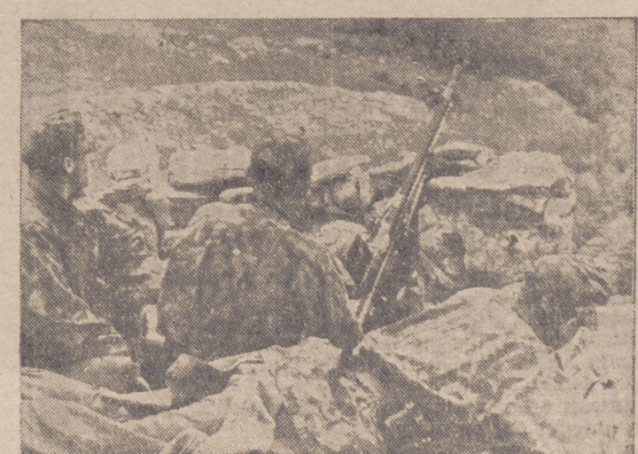
Puesto de observación de la artillería de los cazadores alpinos alemanes, desde el cual dominan las posiciones británicas.