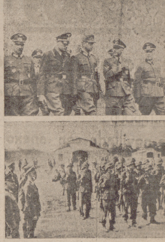
El jefe de la S. E. alemana al lado del rexiaista belga León Degrelle durante la visita a un batallón de voluntarios belgas.