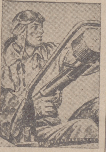
to una resistencia feroz y han rechazado las tentativas de cerco realizadas por formaciones considerables de infantería y de tanques, infligiendo al enemigo enormes pérdidas en hombres y en material. Nuestras pérdidas son también sensibles.

En Túnez, el enemigo ha continuado su ataque encarnizado con una superioridad aplastante. Demostrando un perfecto espíritu combativo, las tropas alemanas e italianas han opues-