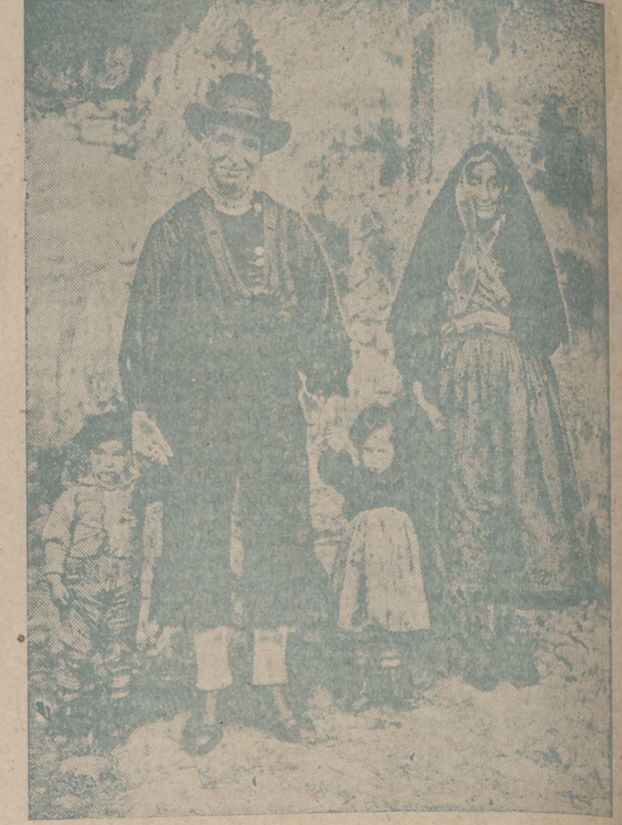
Abuelos y nietos, en un pueblo de La Alberca (Salamanca), con sus típicos trajes