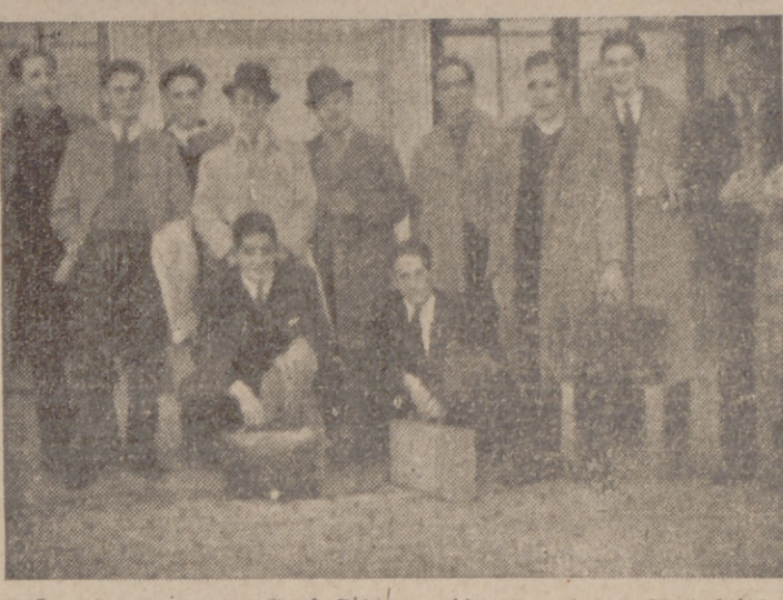
Los jugadores del Real Gijón recién llegados a Valladolid