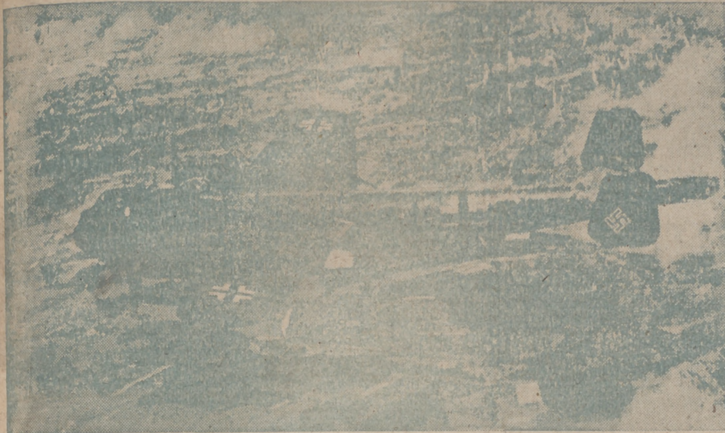
Un nuevo tipo de "Stuka" alemán que ha dado muy buenos resultados. Es el "Do-217", de las fábricas de aviones Dornier.