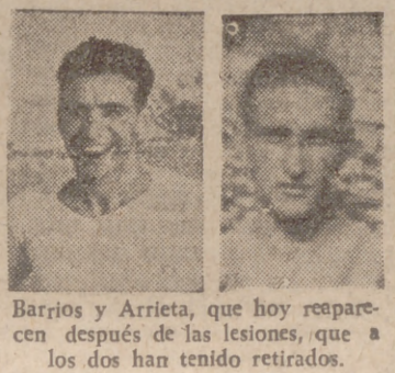
Barrios y Arrieta, que hoy reaparecen después de las lesiones, que a los dos han tenido retirados.

L. A. Formidable liquidación en Pelotería y Perfumería ALONSO. — Santiago, 68