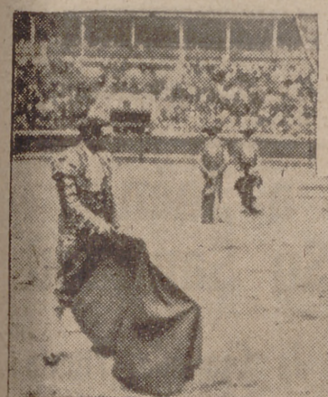
8 de marzo de 1898

Si por cauces nuevos queremos hoy que transcurra la fiesta y que el interés encadene a todos bajo el tema de la pasión, jalémosle de estampas de toros, que serán motivo de relación de factores colocados en el recorrido del torero para llegar al fin o para quedarse en la mitad o al principio. El toro y nada más que el toro es el barómetro de una fiesta, que por algo se llama de toros. La relación de valores, el carnet que acredita la situación del artista no tiene validez si no es fruto de auténticos méritos. Y éstos se calibran con el toro. Lo de menos es la posesión de otras cualidades, cuando se exponen incondicionalmente para la fácil victoria. Esto no es el toro, pese a nuevas concepciones y a gustos conformes más de lo ineffectivo que de lo real. Una cosa es torrear, dominar a la fiera con "arte eficaz", y otra hacer el toro. Entre medias hay un abismo. Algo así como el comer y el recrearse la vista ante ricos manjares teniendo hambre. El día que salga el toro, podremos hablar de todo lo demás.