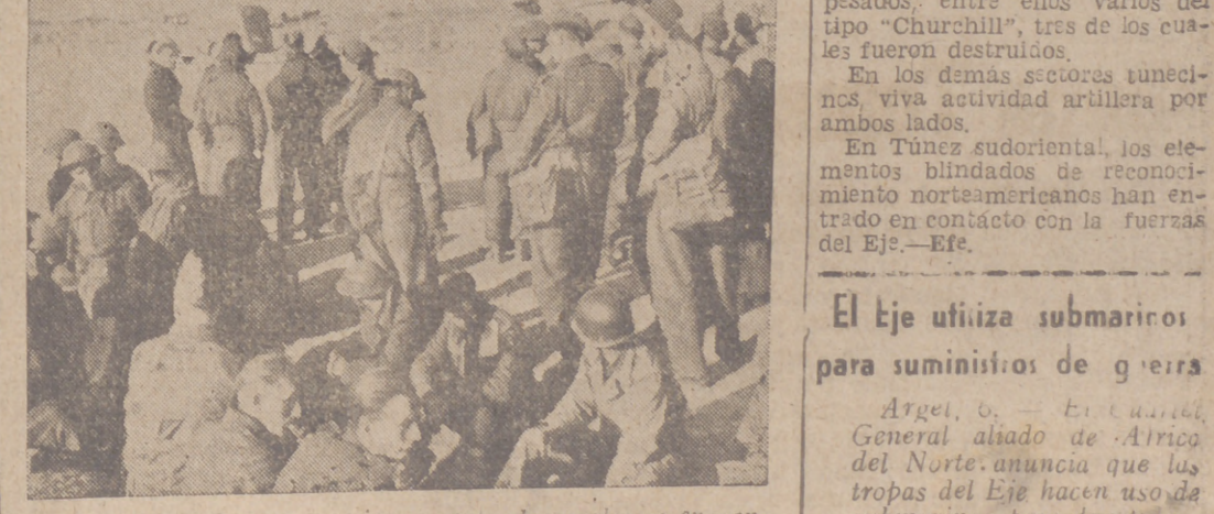
Prisioneros ingleses y americanos, entre los cuales se encuentran también paracaidistas, esperan su transporte al campo de concentración.