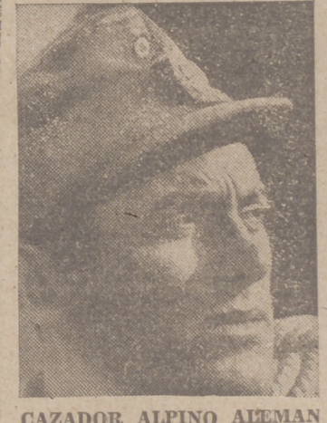
CAZADOR ALPINO ALEMÁN

Argel, 6.—El Cuartel General aliado de África del Norte, anuncia que las tropas del Eje hacen uso de submarinos para los transportes de material de guerra entre Italia y Túnez.