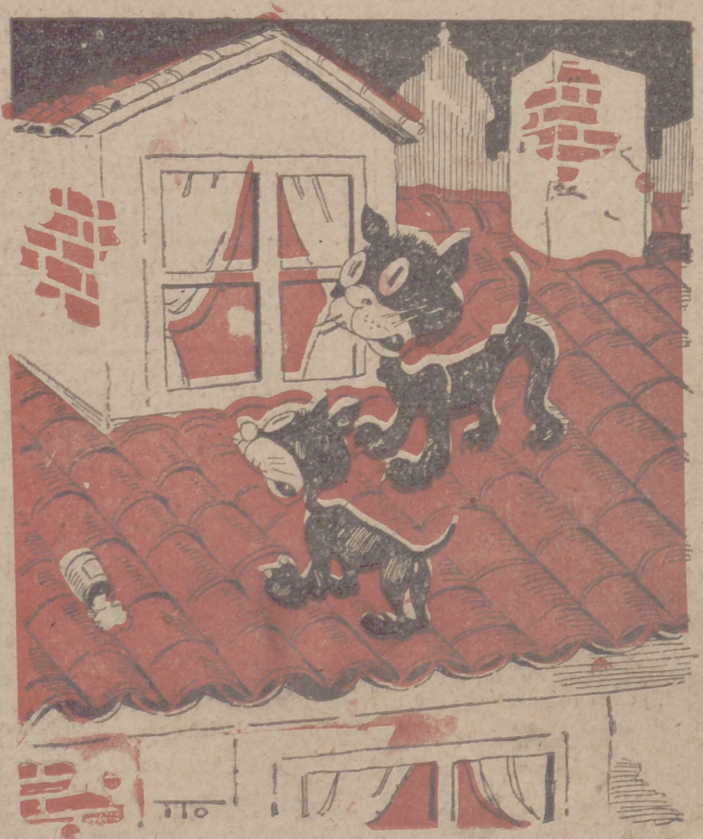
ABUNDANCIA DE PESCADO (Por ITO).—Oye, oye; la casa marcha superior. Hace un montón de años que yo no se ven por ninguna parte los "chicharros".

Sevilla, 6.—El ministro de Hacienda, señor Benjumea, pasa unos días en Sevilla. El viaje tiene carácter exclusivamente particular. El lunes próximo regresará a Madrid.—Cifra.