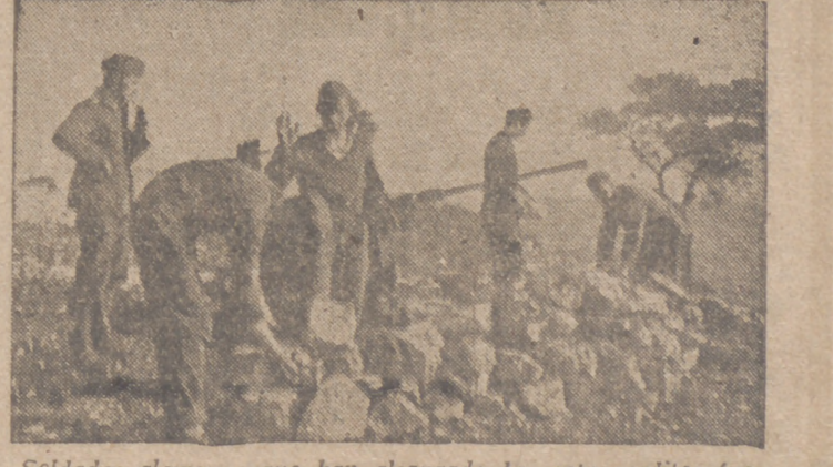
Soldados alemanes que han alcanzado la costa mediterránea de la Francia del Sur, emplazan su cañón de artillería anti-aérea