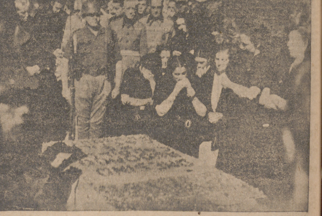
CAMARADAS DE LA SECCION FEMENINA DE LA FALANGE LLORAN, ARRODILLADAS ANTE LA TUMBA DE ONESIMO REDONDO, CAUDILLO DE CASTILLA