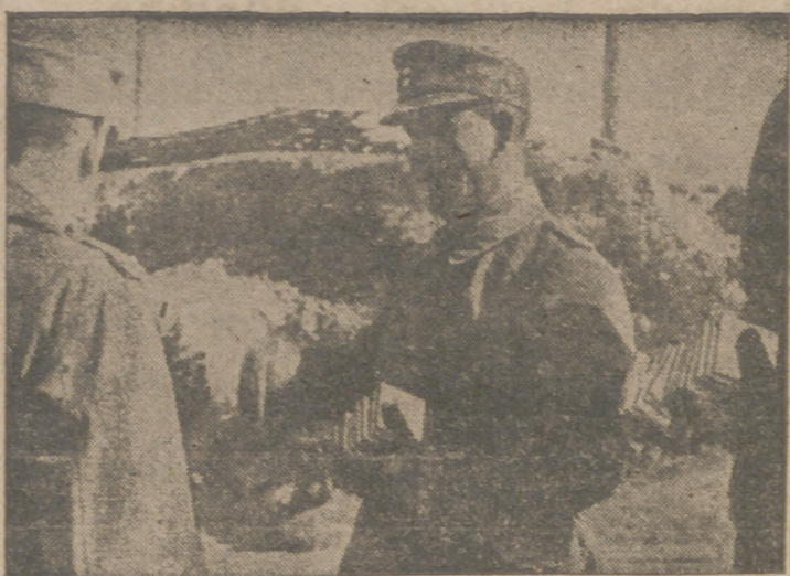
Un jefe alemán, tras las fatigas del combate, reparte tabaco entre sus soldados