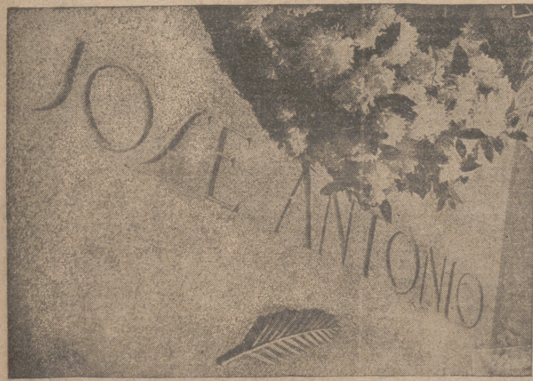
Sobre la lápida que cubre los restos de José Antonio en El Escorial, la Palma de Oro