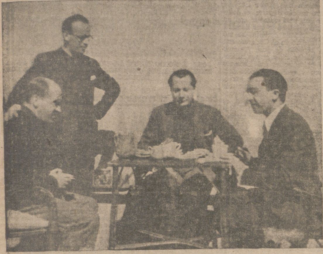
JOSE ANTONIO, ONESIMO, RUIZ DE ALDA Y BRAVO

En el Teatro de la Comedia, hace anualmente nueve años, unos hombres jóvenes montaron en el tinglado carcomido de la sucia política española con el grito de España en la boca y decididos a acabar la esta peregrina que hundía a nuestra Patria en la mediocridad y en el olvido.