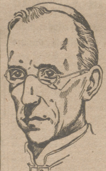
Ciudad del Vaticano, 20.—Su Santidad ha recibido en audiencia especial a un grupo de intelectuales rumanos, presididos por el general Daniel Papp. El Papa pronunció una breve alocución haciendo destacar la importancia y la responsabilidad de las tareas que incumben a los escritores y periodistas en el momento actual, “ya que—dijo—no sólo está en sus manos el concurrir de modo eficaz a mitigar las angustias del inhumano conflicto mundial, sino que pueden además contribuir a preparar los caracteres fuertes y la buena voluntad que en cada país deben cooperar a una paz de justicia y de moderación que tenga en cuenta las necesidades de todos los pueblos.”—Efe.