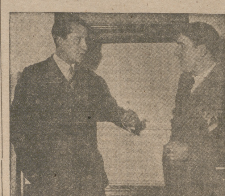
JOSE ANTONIO, EN UNA DE SUS CONVERSACIONES CON RAMIRO

Por todos la Falange tuvo historia, vida y permanencia hoy en el servicio a la Patria, al Pueblo y al Caudillo, Jefe nuestro hoy y de la España nacional-sindicalista.