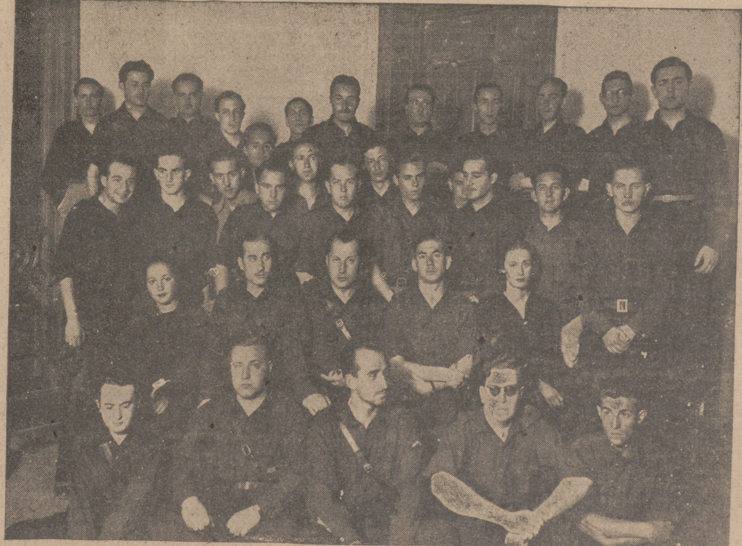
JOSE ANTONIO, CON OTROS FUNDADORES DE LA FALANGE, EN EL PRIMER CONSEJO NACIONAL DEZ S. E. U.

No llevaba José Antonio nunca preparados latiguillos, ni recursos fáciles, ni cubría ni mercantía con frases castellaninas, porque tenía plena conciencia de la imponente gravedad del instante en que se acepta una misión de capitán. El conocía y practicaba las normas que Quintiliano en