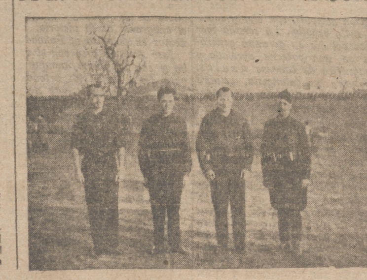
La Falange de Valladolid fue vivero adelantado de los más leales nacional-sindicalistas. A lo largo de su historia, los jonistas vallisoletanos demostraron sus propósitos de servir a la España Una, Grande y Libre de nuestras consignas.

José Antonio, conocedor de su espíritu, lealtad y permanencia en la más generosa entrega a la Patria, tuvo para ella sus mejores consideraciones de Jefe.