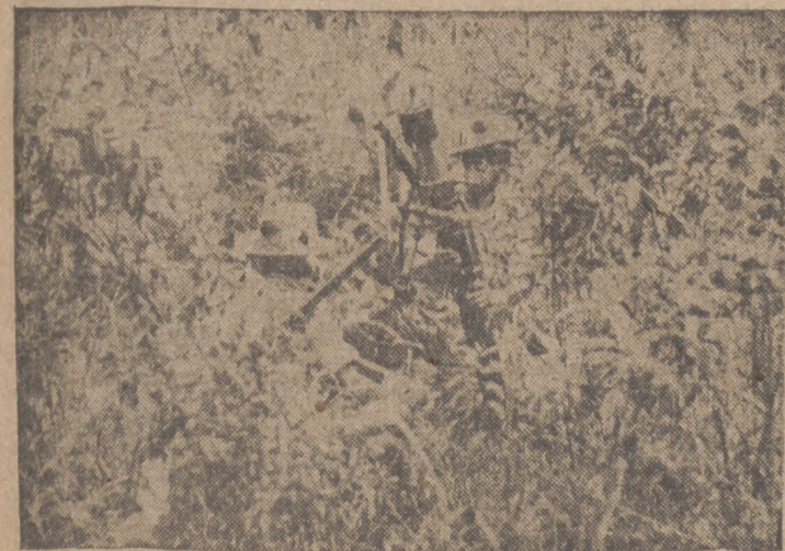
Un puesto de defensa anti-aérea en la selva malaya

Vigo, 28.—En la noche última se han desencadenado sobre la comarca violentos temporales de lluvia, que continúan en la tarde de hoy. La lluvia viene acompañada de los primeros fríos del otoño. Los caminos del rural están inundados y los riuacuelos próximos se han salido también de su cauce.—Cifra.