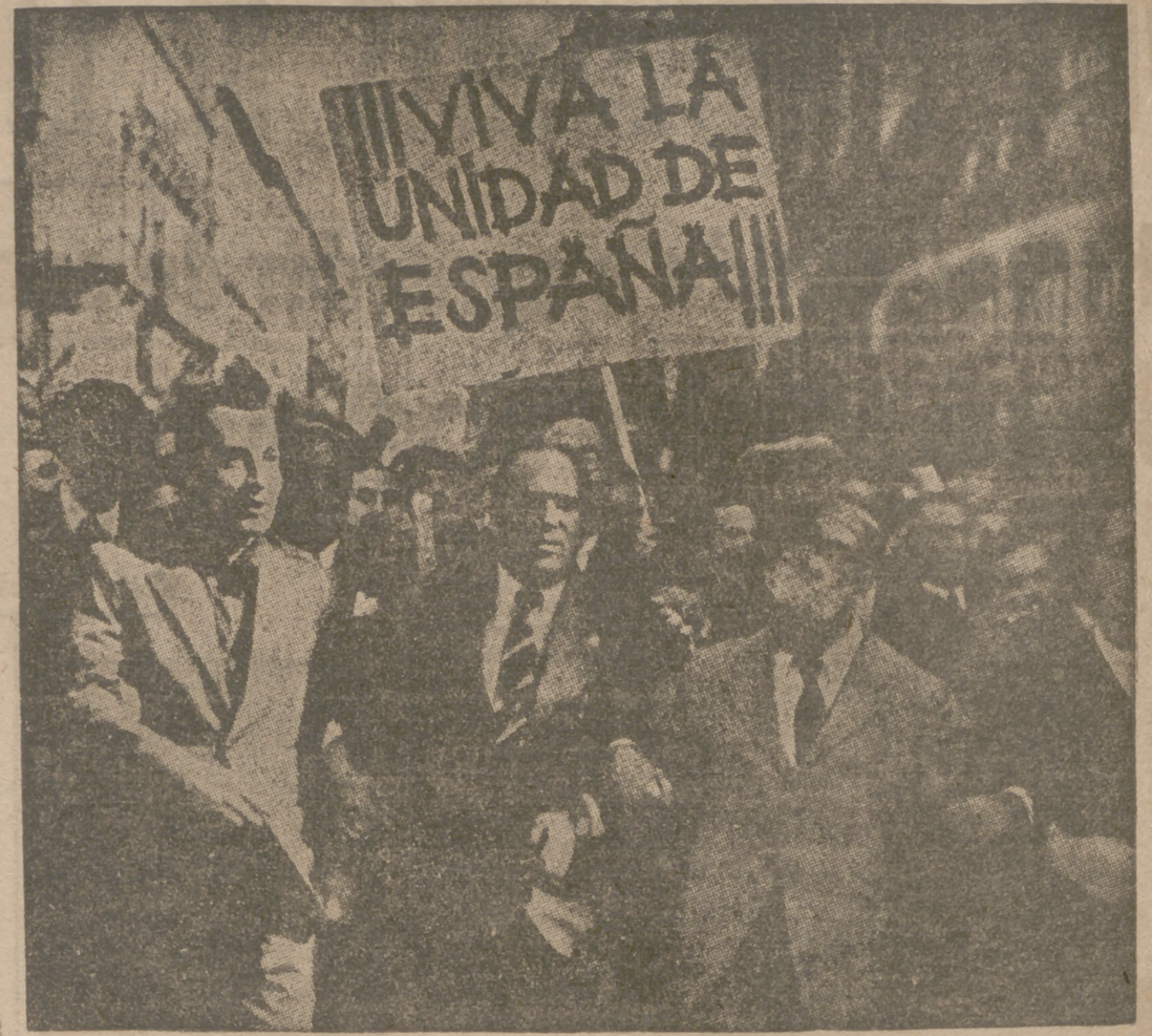
NUESTROS FUNDADORES, AL FRENTE DE LOS MANIFESTANTES, CLAMAN POR LA UNIDAD DE ESPAÑA