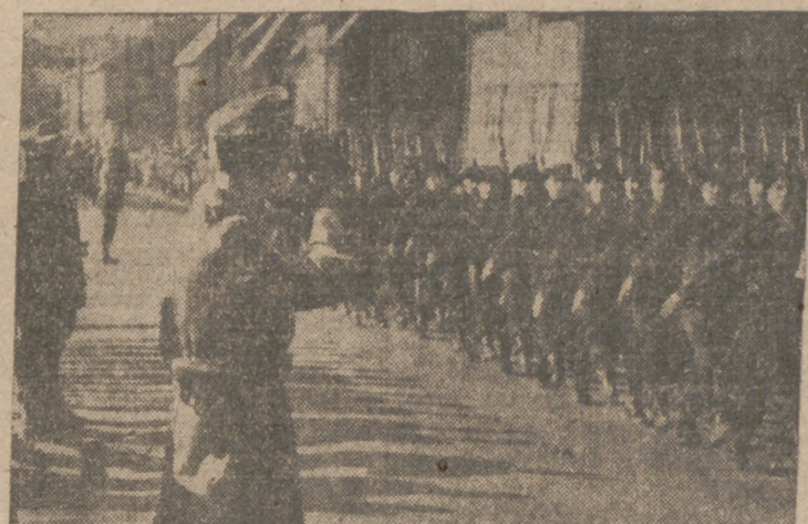
Fuerzas de la Marina alemana desfilando ante el comandante general Dietl en una base del Norte de Noruega

Gran Cuartel General del Führer. 28.—El Alto Mando de las fuerzas armadas alemanas comunica: