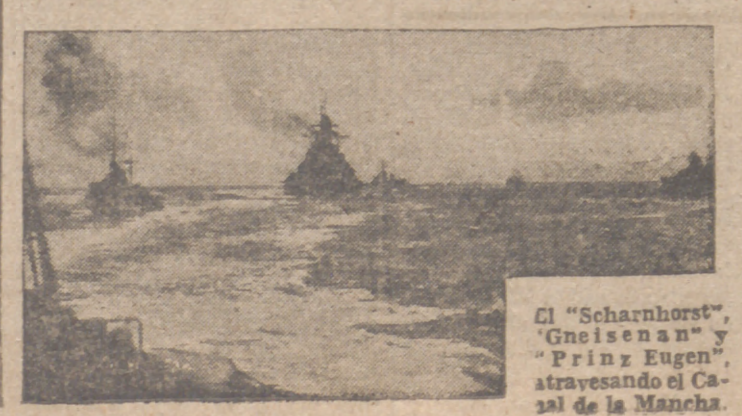
El "Scharnhorst", "Gneisenau" y "Prinz Eugen", atravesando el Canal de la Mancha.