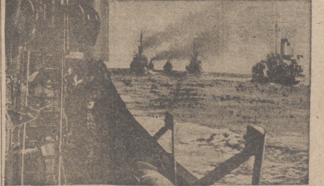
Flotilla de dragaminas alemanes zarpan para prestar nuevos servicios

"No puede existir tampoco unidad y grandeza de España si lo nacional y lo social marchan escindidos o divorciados. Ese fué el mal de nuestras últimas décadas, que viene a corregir nuestro Movimiento" (FRANCO)