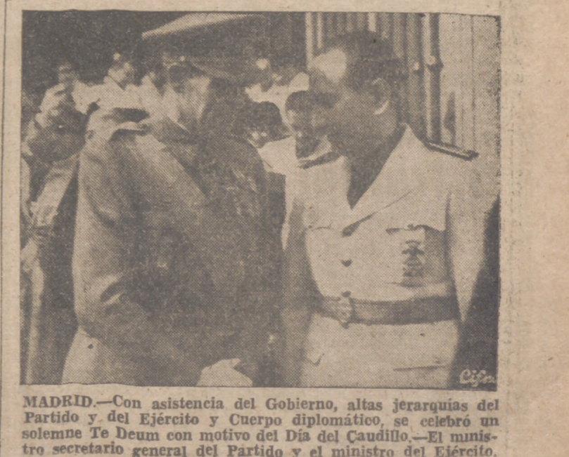
MADRID.—Con asistencia del Gobierno, altas jerarquías del Partido y del Ejército y Cuerpo diplomático, se celebró un solemne Te Deum con motivo del Día del Caudillo.—El ministro secretario general del Partido y el ministro del Ejército. a la salida del acto.

Todo el pueblo le testimonió su fidelidad y adhesión. Sofía, 3.—El rey Boris celebra hoy el 24 aniversario de su advenimiento al trono. Los diarios, todos, dedicaron ayer sus editoriales a esta fecha, que es el propio tiempo la de declaración de la independencia del país. Esta mañana se ha celebrado una solemne ceremonia religiosa. El diario "Dnes", del boque Eubeynamental, dice que "gracias a su sabiduría, a su tacto, a su paciencia y a su amor ilimitado por su país, el rey Boris ha conseguido el resurgimiento de Bulgaria. El pueblo búlgaro sabe que le debe su dicha y, por ello, testimonia a su rey toda su fidelidad y toda su adhesión.—Efe.