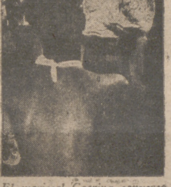
El mariscal Goering conversa con varios soldados heridos en el frente del Este