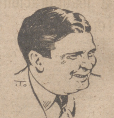
Myron Taylor, representante personal del presidente Roosevelt cerca del Vaticano, ha sido recibido hoy por el Cardenal Maglioni, secretario de Estado, quien saldrá probablemente para Casoria, donde permanecerá unos días descansando.