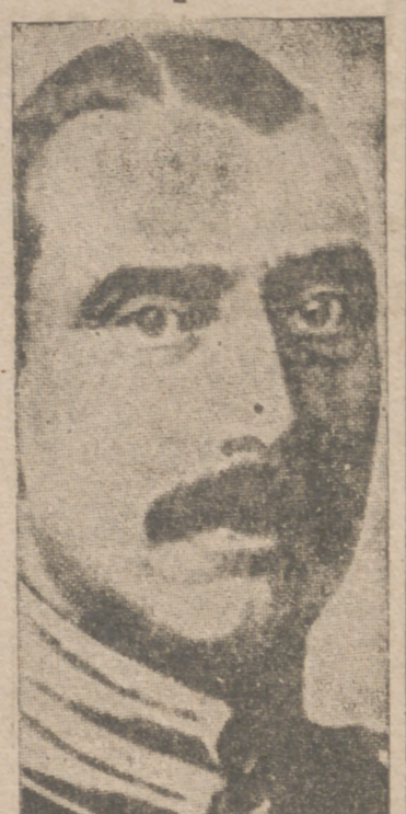
Gran Cuartel General del Führer, 25.—El Führer ha enviado un telegrama de felicitación al rey de Dinamarca con motivo de celebrar este su cumpleaños el próximo día 26.—Efe.

El delegado de Madrid, camarada Lostao, quien da cuenta minuciosa del funcionamiento de cada uno de los Servicios. Habla de la organización de las cuarenta y dos centurias de Falanges de Voluntarios y destaca la disciplina de las dos centurias de Guías Montañeros que realizan marchas y campamentos volantes durante todo el año. Expone el proyecto de instalar en el Pardo talleres-escuelas de iniciación profesional, donde los flechas adquirirán las enseñanzas preliminares que les faciliten el acceso a otras superiores, y da cuenta de otros varios problemas, apuntando las soluciones que cree más adecuadas.