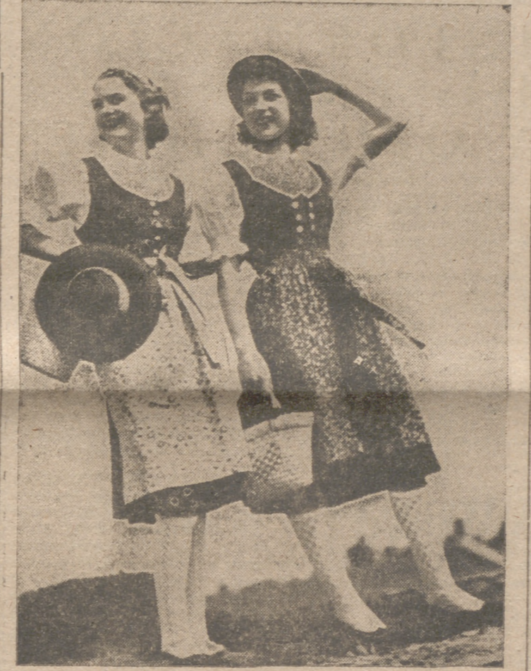
MODA ALEMANA.—Dos vestidos en estilo de campesina, que se componen de una blusa blanca de hilo y falda floreada. Encima de ésta se lleva un delantaj también estampado o liso.

La segunda mitad de la sesión fue presidida por el delegado nacional de excautivos, marqués de la Valdavia, quien, al final, anunció que mañana, a las doce de la mañana, se celebraría la sesión de clausura en el Salón de Ciento del Ayuntamiento. Por último, el marqués de la Valdavia leyó la invocación a los caídos y se cantó el "Cara al sol". El delegado nacional dijo los gritos de ritual, que fueron contestados con gran entusiasmo por todos los excautivos asistentes al Consejo.—Cifra.