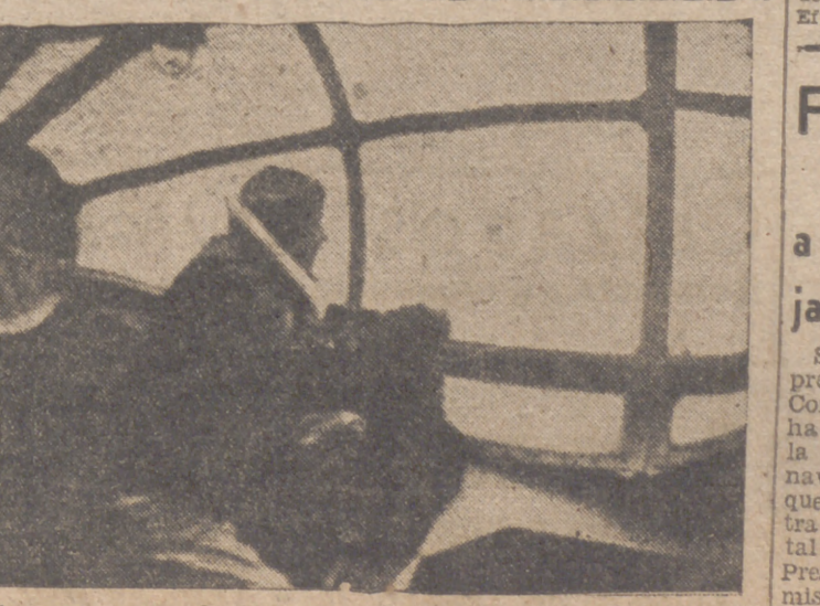
Como un grupo de poltueros, un convoy se observa desde la "ampolla" de un aeroplano de patrulla