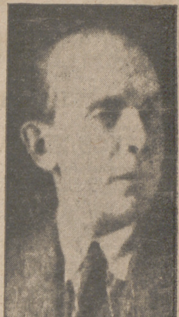
El secretario de Estado en el Ministerio de Justicia del Reich, Dr. Freisler, nuevo presidente del Tribunal Supremo.

"Parte de las fuerzas navales japonesas avanzó hasta el Atlántico y participa actualmente en operaciones estratégicas en colaboración con las flotas del Eje. Un submarino japonés que opera en el Atlántico localmente en una base naval alemana y ha zarpado para la zona marítima estratégica."—Efe.