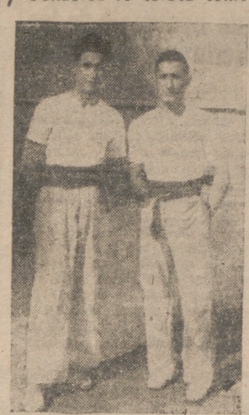
La pareja "Alpi"-Ciguñuela, que hoy disputarán al "Niño de la Palma" y a González...