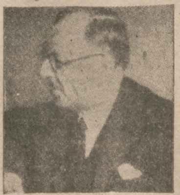
Angora, 25.—Saradjoglu, presidente del Consejo de Ministros, ha sostenido una entrevista de dos horas de duración con el embajador de los Estados Unidos, Steinhardt.—Efe.

como un silencioso y emocional "alto el fuego" ante la tempestad que huía vencida. Después, nuestro himno se confundió con el trueno lejano y llega, ya adentrados todos nosotros en la oscuridad de la noche, tanto como la lluvia torrencial que nos perseguía torrencialmente, la oración a los caídos, en un casi anfiletado para las batallas, iluminado por las ráfagas de los relámpagos. Y allí fué cuando corazones y pulsos juveniles sintieron la fluencia de una sangre, pronta al sacrificio, fuertemente acelerada. Emoción en los corazones que rezaban por nuestros gloriosos muertos con el convencimiento de que cada día se inscriben nuevos nombres en los epitafios conmemorativos, de que cada día nos llega, desde el fondo de una Rusia maldita, una lista de honor y sacrificio con los nombres de nuestros camaradas mejores.