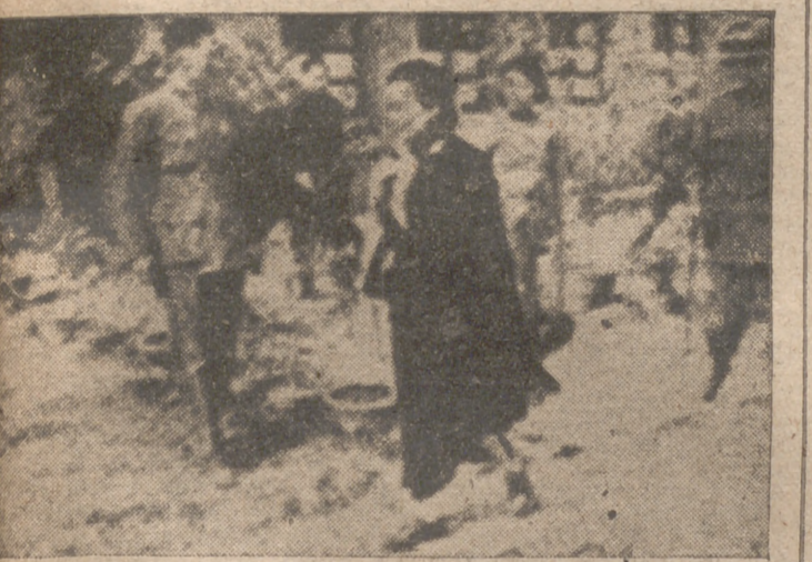
Los "Tigres voladores" incorporados al Ejército del Aire americano.—La señora Chiang-Kai-Chek es una de las más entusiastas admiradoras de los "Tigres voladores". Ella y su esposo (a la derecha) han sido fotografiados al salir del Estado Mayor del general Chennault.

El acto comenzó con unas palabras del Hermano Rodríguez, explicando la significación de la clausura, y concluyó con la clausura oficial por la delegada nacional de la Sección Femenina. Por último se cantó el "Cara al sol", dando los gritos de ritual Pilar Primo de Rivera.—Cifra.