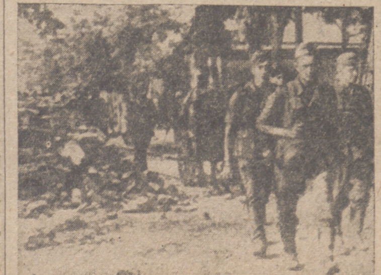
Pasado el Don, continúa la persecución del enemigo.—También a la otra orilla del Don continúa la maniobra alemana su avance contra el enemigo, a través de pueblos y barricadas.

Y termina: "El meridiano escogido por nosotros no puede dejar de ser el de Lisboa".