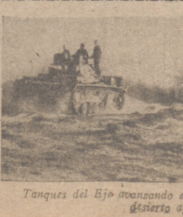
Tanques del Eje avanzando en las llanuras arenosas del desierto africano

Ciudad Real, 18.—En la última sesión celebrada por la Diputación Provincial se acordó solicitar del Ministerio de Educación Nacional la construcción de un edificio en esta capital destinado a Escuela de Comercio, obra a la que contribuirá la Diputación con el 50 por 100 de su coste.—Cifra.