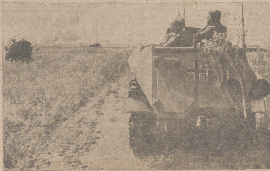
Un momento de la lucha desarrollada recientemente en la batalla de Oribaiwa

Presburgo, 18.—En el Hotel Carlton, el ministro de Hacienda, Průzinsky, ha ofrecido una comida en honor del ministro de Hacienda del Reich, conde Schwerin Von Krosigk. Asistieron los miembros del Gobierno eslovaco, el ministro del Reich, Ludin, y varias personalidades del mundo financiero de Eslovaquia. A las 7,30 de esta mañana el conde Schwerin Von Krosigk ha comenzado su viaje a través de varios distritos eslovacos. Este viaje durará exactamente hasta el 29 de septiembre.—Efe.