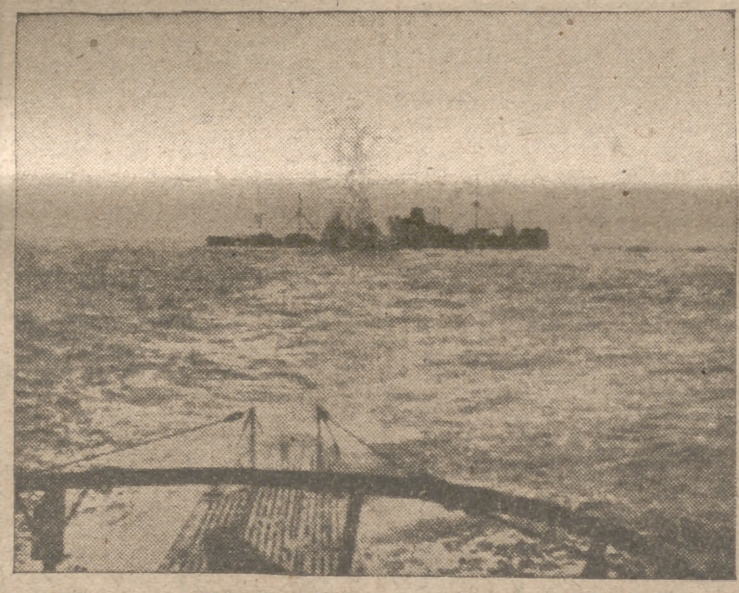
Un buque inglés atacado por un submarino alemán. En la foto se ve una parte del sumergible atacante