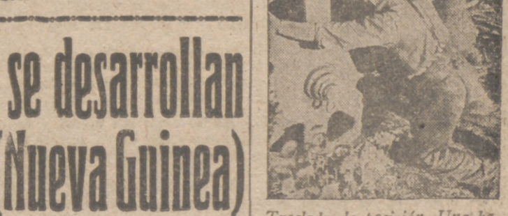
Traslado de posición. Una batería alemana es llevada a otra posición más avanzada con el esfuerzo de sus servidores. Los escasos de toda clase de comunicaciones obliga a realizar grandes esfuerzos a los soldados.

en la reunión y expresa la esperanza de que el nuevo impulso que se trata de dar a la juventud de Francia la permitirá colaborar en un porvenir próximo en esas tareas.—Efe.