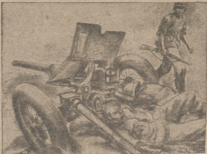
ESCENA DE LA GUERRA EN EL ESTE.—Un soldado alemán, en su avanzada, pasa ante un antitanque soviético, cuyos servidores no dispararán ya contra el Ejército del Reich

13, martes, octubre. No dejes de jugar a la Lotería de la Cruz Roja. Premio mayor, dos millones de pesetas