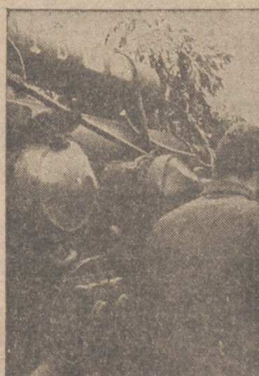
De la lucha en la región de Stalingrado.—Cañones antiaéreos pesados alemanes aseguran los flancos de las tropas que persiguen al enemigo

Zaragoza, 16.—El alcalde ha recibido esta noche el telegrama siguiente: "Su Excelencia Jefe Estado y Generalísimo me encarga le exprese su reconocimiento por su amable telegrama en el que muestra su satisfacción y gratitud al comenzar sus tareas la Academia General Militar. Salúdale, General Franco Salgado".—Cifra.