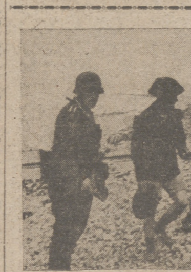
Después del fracasado intento inglés de invasión en Dieppe, los alemanes hacen salir de sus escondrijos a los últimos soldados ingleses

a numerosas localidades de Albacete, Santander, Málaga, Lérida, Burgos, León, Valencia, Toledo, Granada, Cáceres, Badajoz, Huesca, Madrid y Murcia.—Cifra.