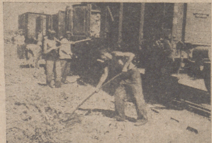
Con toda rapidez se comienza la reconstrucción y limpieza detrás de las primeras líneas alemanas. En estos trabajos colabora la población civil