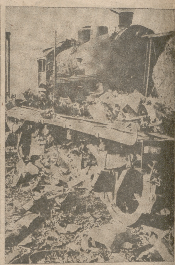
EN UNA ESTACION DE LA LINEA DEL FERROCARRIL CAUCASICO—Lo que ha quedado de un tren de municiones soviético después de un ataque de los "Stukas"

Angora, 12.— Procedente de Estambul ha llegado a esta capital el presidente de la República, Ismet Inonu.—Efe.