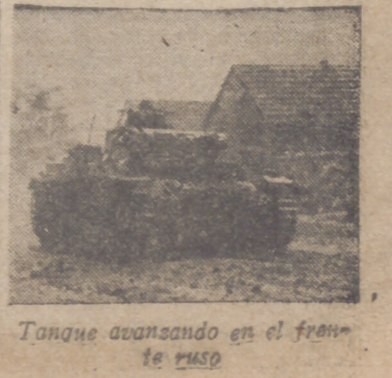
Tanque avanzando en el frente de Rusia

Washington, 12.—Nada indica que las relaciones entre Francia y los Estados Unidos puedan sufrir cambio alguno por el hecho de la nueva acción británica en Madagascar, ha declarado hoy Hull en su conferencia con los periodistas.—Efe.