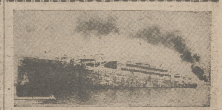
He aquí un buque inglés destruido por las fuerzas navales del Eje en el puerto de Tobruk

neal), ha declarado un portavoz oficial. Refiriéndose al ataque contra los destructores nipones en aguas de la isla de Normanby, el portavoz añadió que se libraron dos acciones navales separadas por un breve intervalo de tiempo. El primer ataque fue efectuado por torpederos volantes y el segundo por hidroaviones tipo "Hudson".—Efe.