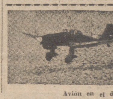
Avión en el desierto africano