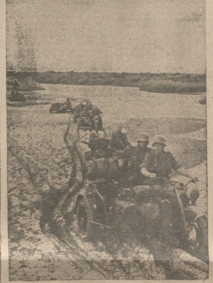
Un grupo motorizado de vanguardia en avance en la gran curva del Don, que hoy ya está en manos de los alemanes

pergamino ricamente decoradas por Domingo Crespi, pintor valenciano del siglo XV. Empieza dicho libro del consulado del mar con un sectorial y lunario; sigue el orden judicial del consulado, que consta de 46 capítulos; después los usos y costumbres del mar, con 257 capítulos, y a continuación los 41 capítulos del rey don Pedro, titulados "Las costumbres del mar