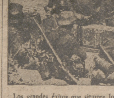
Los grandes éxitos que siempre lograron los soldados alemanes dependen, por lo demás, de su rapidez. Así, los buques de asalto alemanes forzaron el paso del Dan.

Estocolmo, 5.—El submarino sueco "Sjobergen" ha sido abordado en los arrecifes de Soedermanland por un barco mercante también sueco. Resultó hundido el sumergible, y de su tripulación solamente falta uno de los marinos. Han sido adoptadas disposiciones para poner a flote al submarino.—Efe.